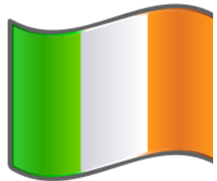
Imagen de wikimedia bajo licencia de Creative Commons

Aquí en este enlace tienes un listado completo de las más importantes del mundo.