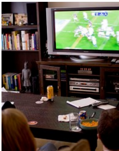
Imagen en Flickr de dennis bajo licencia CC