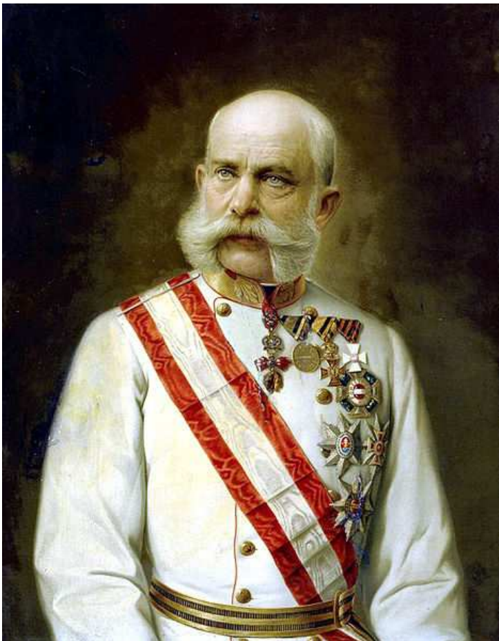
Retrato del emperador Francisco José de Austria al óleo

Vamos a echar un vistazo a lo mejor del siglo de las revoluciones, pero antes fíjate detenidamente en estas dos imágenes.