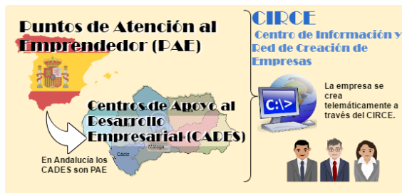
Puntos de Atención al Emprendedor Diagrama de elaboración propia

Los PAE pueden depender de entidades públicas o privadas, colegios profesionales, organizaciones empresariales o cámaras de comercio. Los PAE se apoyan en el Centro de Información y Red de Creación de Empresas (CIRCE) para crear empresas. El ahorro en costes y sobre todo tiempo es enorme, ya que todos los trámites se centran en un sólo lugar: el PAE.