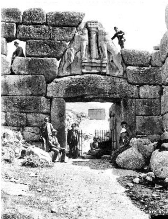
Heinrich Schliemann en la Puerta de los leones.