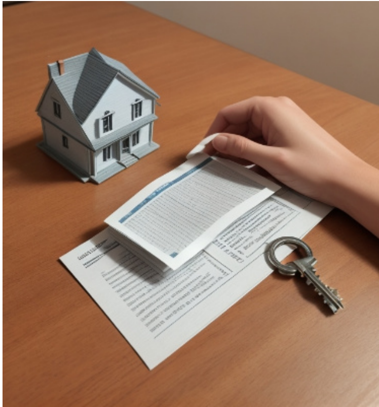
Imagen de elaboración propia empleando Leonardo.ai.