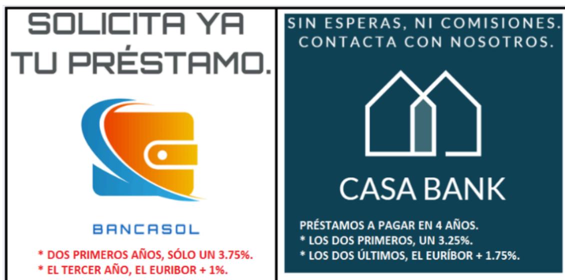
Imagen de elaboración propia. Dos ofertas hipotecarias. (CC BY-NC-SA

A la vista de las dos ofertas hipotecarias siguientes, debemos decidirnos por la más beneficiosa o ventajosa para nuestros intereses. En concreto, necesitamos un préstamo de 20000 € para la adquisición de un apartamento y nos ofrecen las siguientes propuestas: