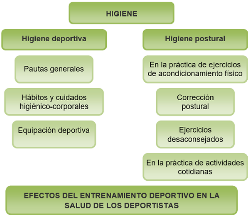
Mapa conceptual Imagen de elaboración propia

En este tema abordaremos la higiene desde una perspectiva postural, deportiva y en la práctica de actividades cotidianas. Con la ayuda de una educación para los deportistas y para los no deportistas en los aspectos mencionados, podemos prevenir lesiones, infecciones o algún tipo de enfermedad asociada a una incorrecta higiene, tanto deportiva como referida a la postura. Por otro lado, también trataremos los efectos del entrenamiento deportivo sobre la salud de las personas que lo practican. Si bien se sabe que los beneficios del ejercicio físico son múltiples y que tiene muchos efectos sobre la salud de la persona, hemos de tener en cuenta qué tipo de ejercicios y efectos son los que se asocian a una práctica deportiva y a la salud, para poder realizar ejercicio físico y deporte con el menor riesgo posible de lesión y orientar nuestra práctica hacia los objetivos perseguidos. Para ayudar al estudiante a resumir los contenidos de este tema, el siguiente esquema muestra qué aspectos estudiaremos.