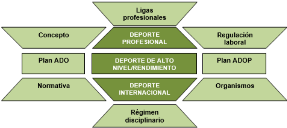
Mapa conceptual Imagen de elaboración propia

Con este tema se pretende que el alumnado aborde las cuestiones legales que enmarcan el deporte internacional, haciendo hincapié en el Olimpismo, las medidas destinadas a extender la práctica deportiva de forma universal por encima de cualquier manifestación de discriminación, la regulación de infracciones y las organizaciones encargadas de velar por ello. En otro orden de cosas, también se abordan las consideraciones del deporte de alto nivel y alto rendimiento, así como los planes y medidas vigentes en España para tales consideraciones.