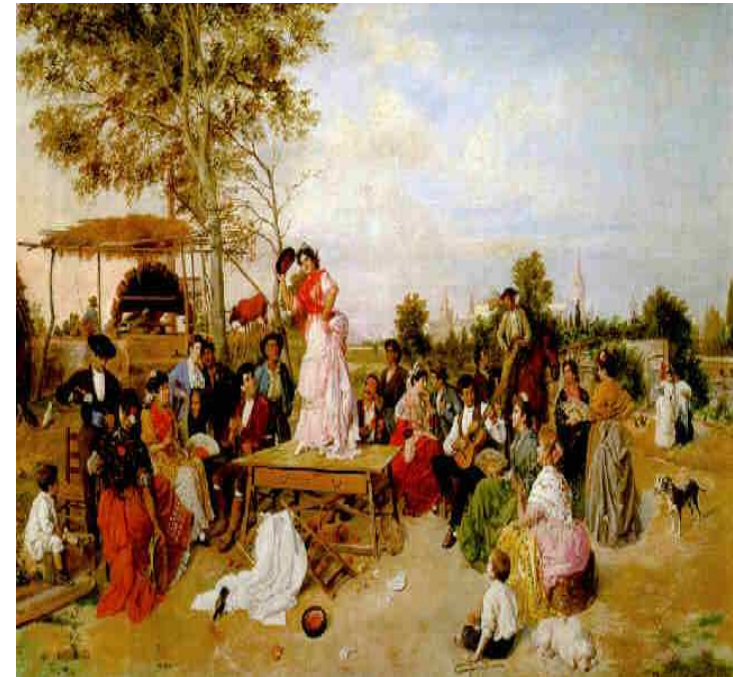
Imagen 1. Autor: Manuel Cabral Aguado Dominio público