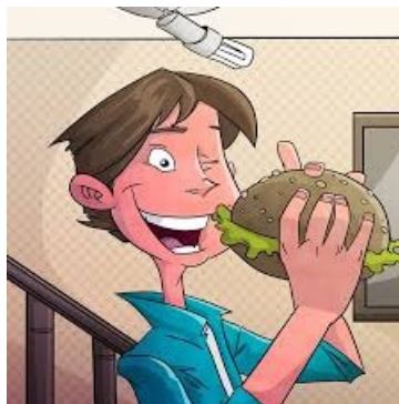
Imagen de andresantamns en Pixabay con licencia PD

Veamos otro ejemplo para que aprecies con mayor claridad la diferencia entre ambas. En la oración Mi madre no me ha preparado la merienda porque yo he llegado tarde tenemos dos verbos " ha preparado " y " he llegado ". Cada uno de esos verbos constituye un predicado que, a su vez, supone la existencia de dos proposiciones " Mi madre no me ha preparado la merienda ", " yo he llegado tarde ". Estas proposiciones, que juntas forman una unidad mayor, la oración, carecen de independencia semántica de forma aislada: " Mi madre no me ha preparado la merienda " porque " yo he llegado tarde ".