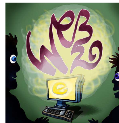
Imagen 4. Autor: Welleman . Dominio público