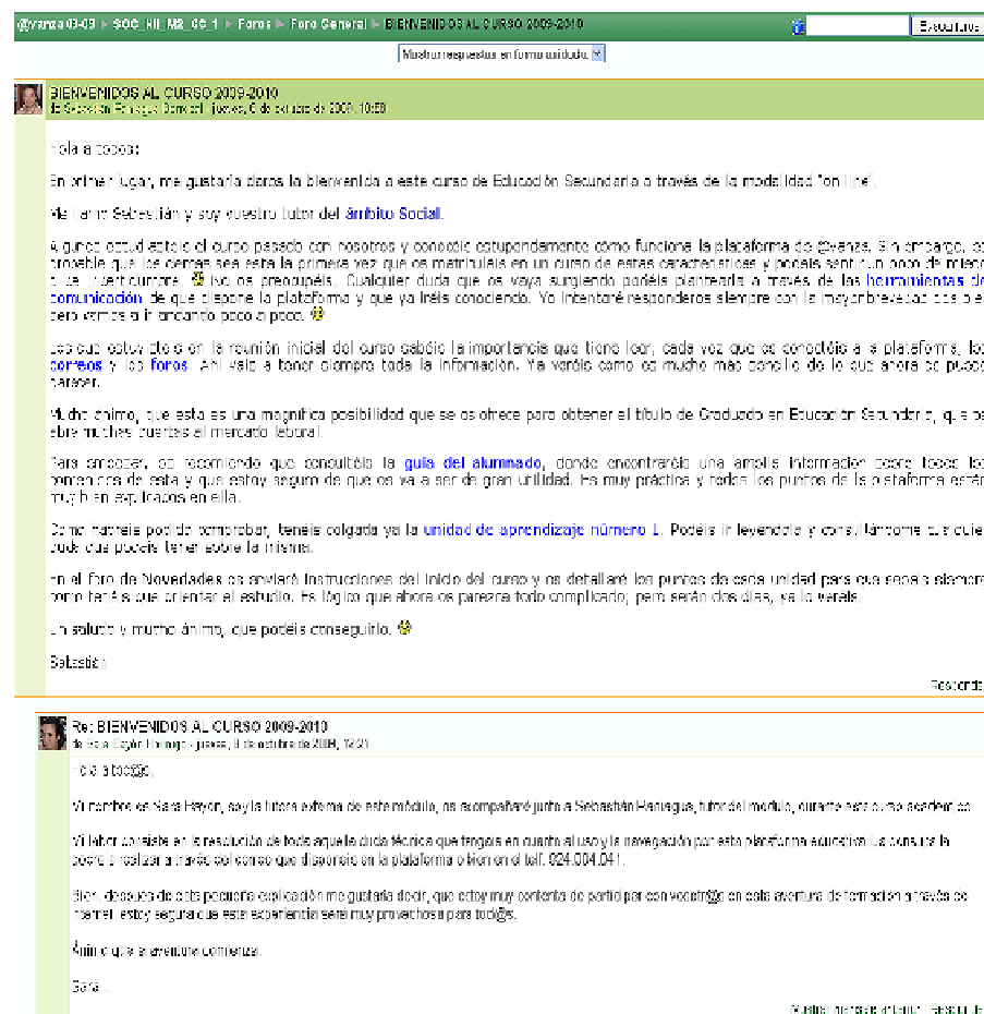
Imagen 7. Elaboración propia. Derechos cedidos a la Consejería de Educación, Junta de Andalucía