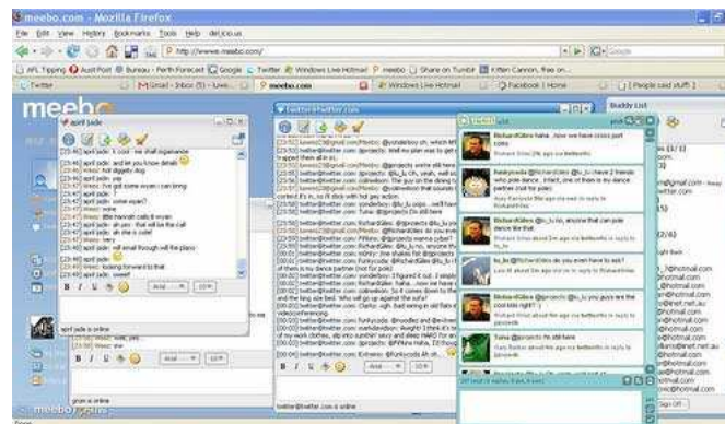
Imagen 5.

¿Qué caracteriza al lenguaje usado en los chats?