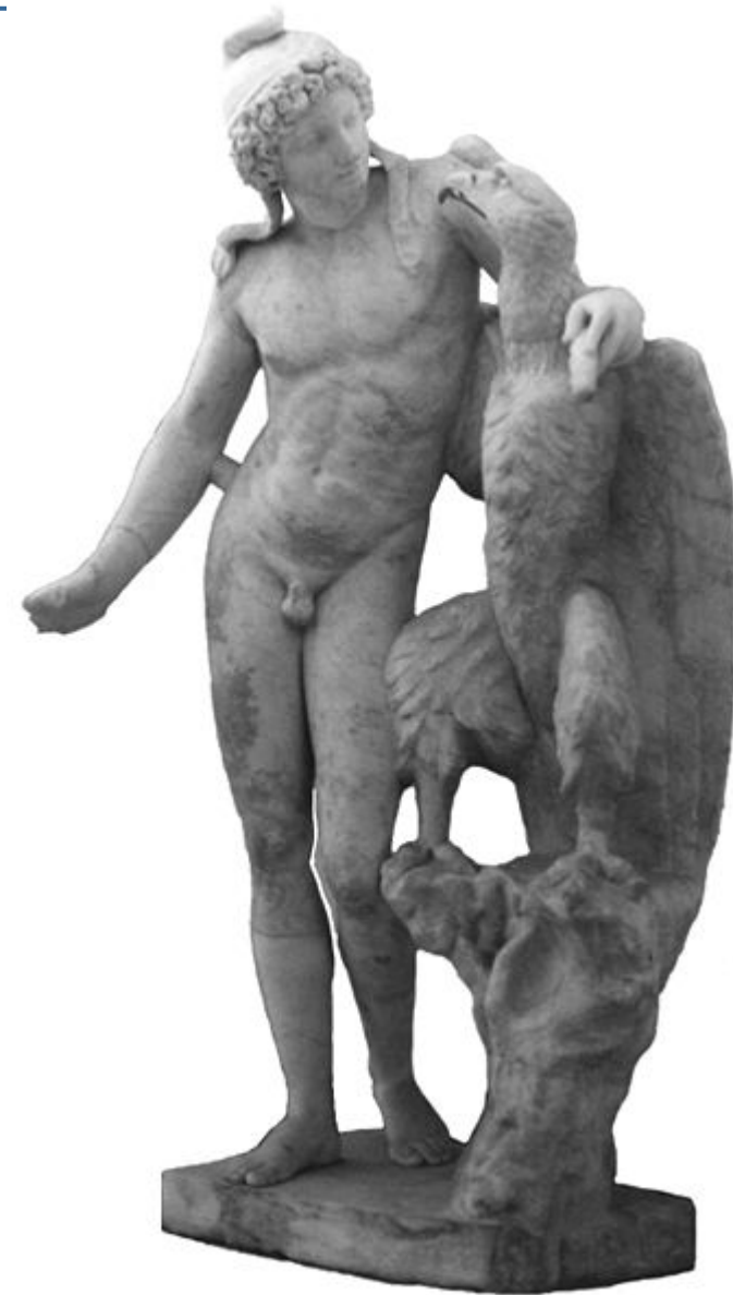
Zeus y Ganimedes