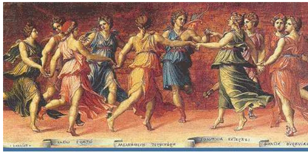
Baldassarre Peruzzi, Las Musas