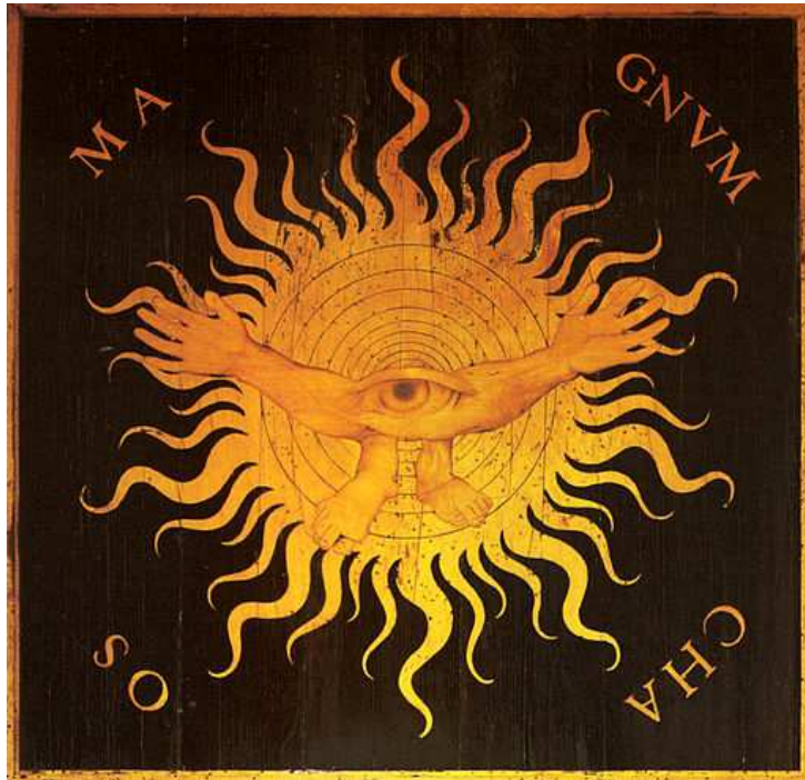
Capoferri y Lotto, Magnum Chaos . Imagen de dominio público.