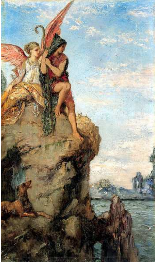
G. Moureau, Hesíodo y la Musa Imagen de dominio público

PASTOS DE ASCRA MONTE HELICON, BEOCIA C. 720 ANTES DE CRISTO