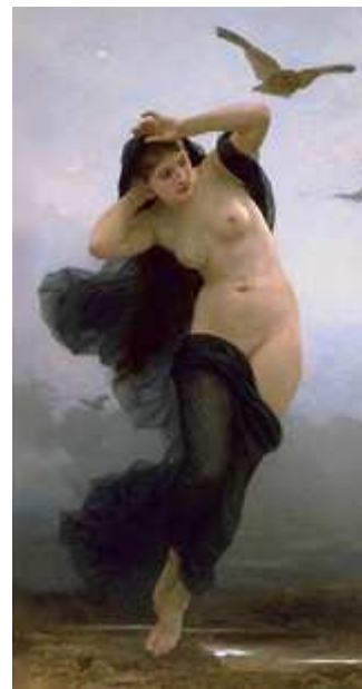
W.A. Bouguereau, La Noche .