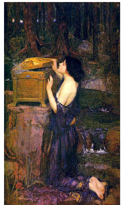
J.W. Waterhouse, Pandora

De Gea (la Tierra) nace primero Urano , seguidamente las Montañas y el Ponto , de agitadas olas. En unión con Urano, alumbró a los Hecatonquiros , a los Cíclopes y a los Titanes . Crono fue el más joven de ellos. Relata Hesíodo la castración de Urano a manos de Crono. Así liberó el dios a su madre y hermanos de