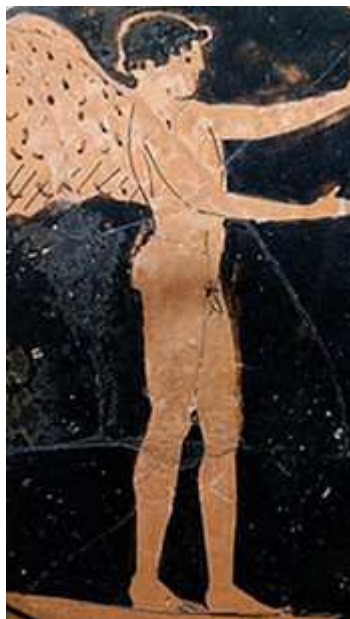
Pintor de Londres, Eros .