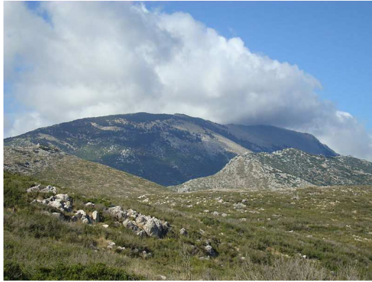
Monte Zagarás (el "Helicón" de la antigüedad)

νάσσατο δ' ἄγχ' Ἑλικῶνος οἰζυρῇ ἐνὶ κώμῃ Ἀσκρι, χειῖμα κακῇ, θέρει ἀργαλέῃ, οὐδέ ποτ' ἐσθλῇ.