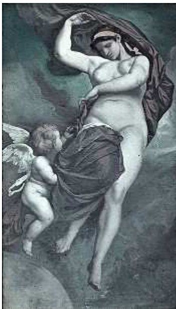
A. Feuerbach, Gaia .

Texto adaptado por Javier Almodóvar en www.antiquarius.es