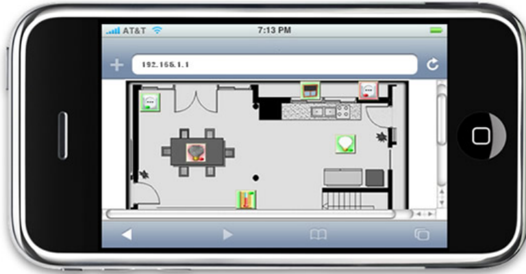
Imagen de Roberto Cer en wikimediacommons . Licencia CC0