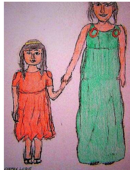
GIL: ancilla et filia

Del latín aut proviene nuestra conjunción "o". El diptongo au evolucionó a -o- y la consonante -t- final se perdió. A veces, como en castellano, esta conjunción aparece repetida delante de cada uno de los elementos que une.