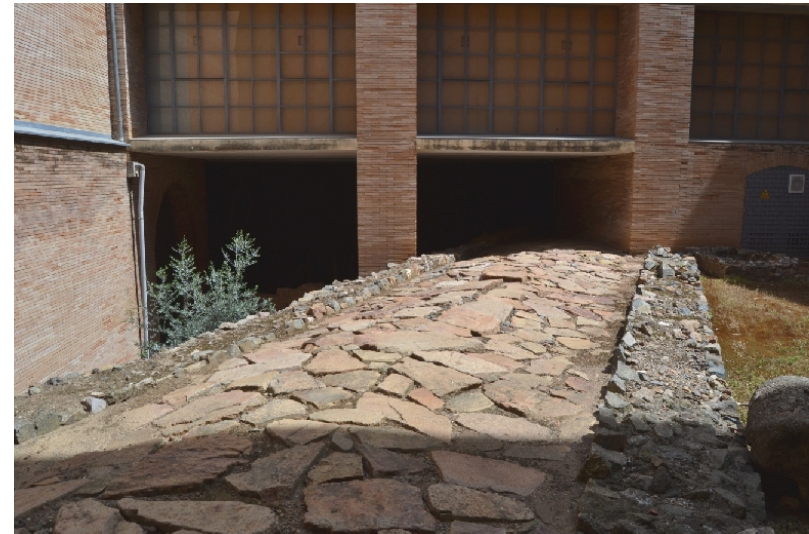
Calzada romana en Mérida

Los futuros imperfectos latinos desaparecieron en las lenguas romances. El español los formó nuevamente mediante una perífrasis formada por el verbo haber detrás del infinitivo presente: amar he > amaré, amar has > amarás, etc. Recuerda, pues, que en castellano el futuro se forma con el morfema: -ré / -rá (cantaré, partirás, temerá, amaremos, cogeréis, brillarán)