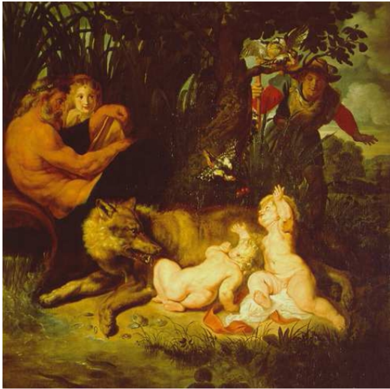
P. P. Rubens: La loba, Rómulo y Remo