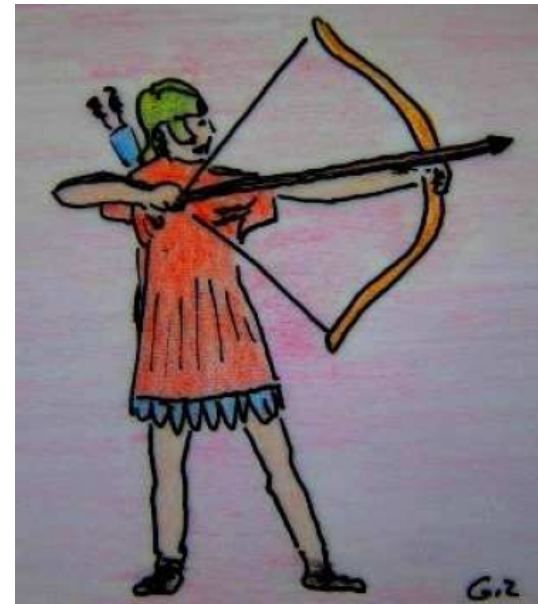
GIL: agricola feras sagittis Recurso de elaboración propia