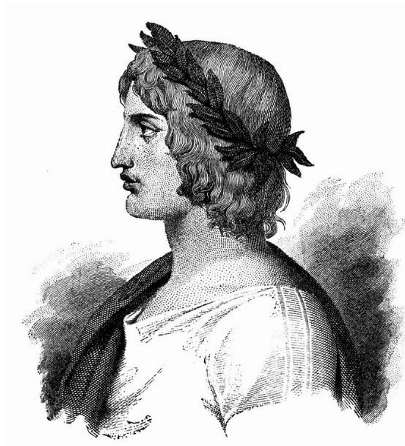
Virgilio, el gran poeta romano