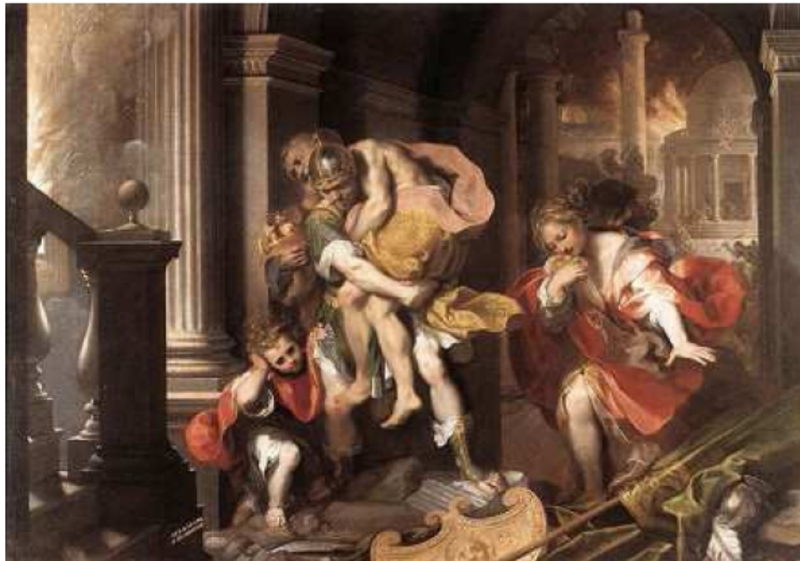
Federico Barocci Creusa, Eneas, Anquises y Ascanio huyen de Troya en llamas

Las leyendas nos hablan de las vicisitudes de un héroe troyano, Eneas , hijo de Venus y Anquises. Éste, tras la destrucción de Troya, se quedó sin patria y tuvo que huir de su ciudad en busca de una nueva tierra. Comenzó para él un largo viaje por las costas del Mediterráneo en busca de un nuevo lugar donde habitar. Tras varias peregrinaciones, los Troyanos desembarcaron en el Lacio, frente a la desembocadura del río Tíber.