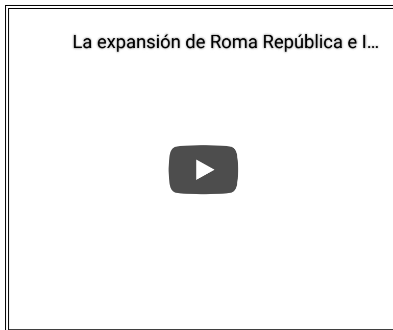
Mapa dinámico sobre la expansión de Roma Vídeo de Superfaetonte en Youtube

El siguiente vídeo muestra de manera muy resumida el proceso de expansión de Roma durante esta tres etapas.