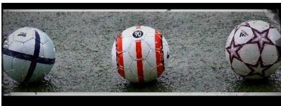
Imagen de vecinodelquinto! en Flickr . Licencia CC