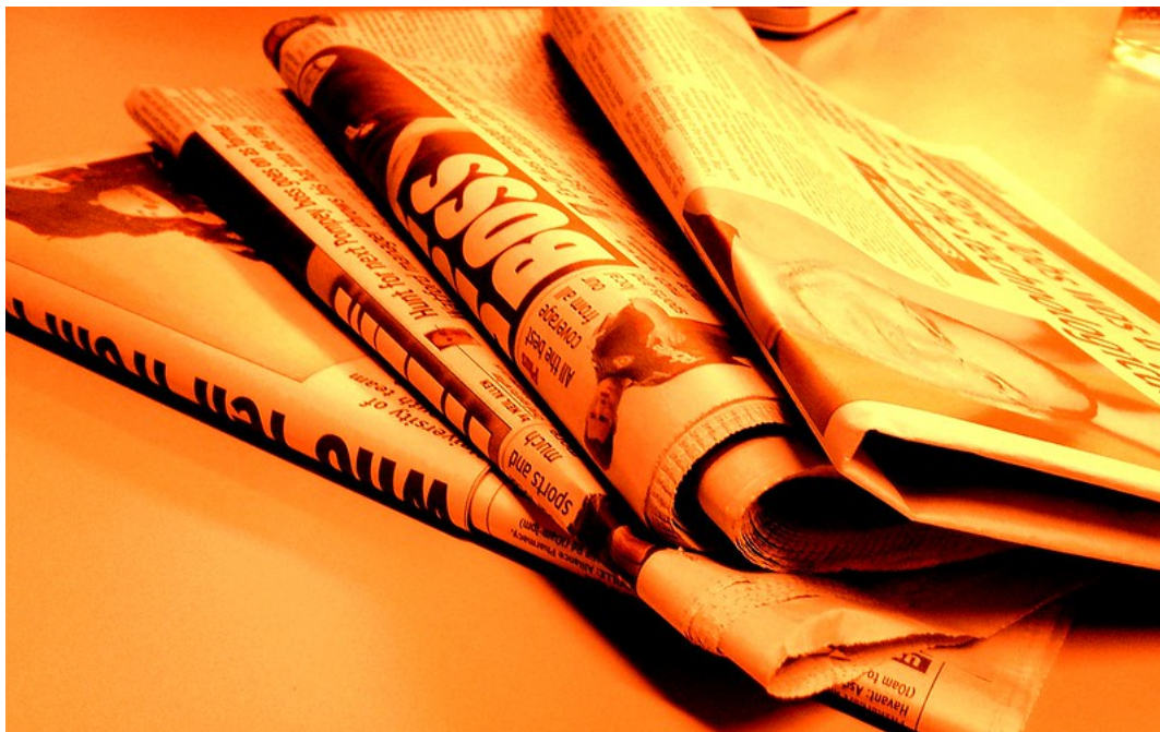
Imagen de Jon S en Flickr . Licencia CC

Como ya te hemos venido explicando a lo largo del tema hay que distinguir entre información y opinión . Ambas son necesarias, pero han de ir en espacios y en géneros diferentes. Tú como receptor debes diferenciar si estás ante una noticia objetiva (que te informa) o ante la opinión subjetiva de un emisor o de un grupo. Una de las maneras más sutiles de manipular al lector es introducir opinión en la información. Recuerda que cada medio o empresa lleva su línea editorial, es decir defiende sus propios intereses ideológicos y económicos, y los trabajadores de ese medio están condicionados por esa manera de enfocar los temas y las situaciones.