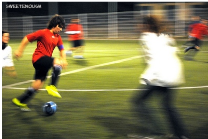
Imagen de sweetenough en Flickr . Licencia CC

Lee con atención el siguiente texto de opinión sobre el enfrentamiento dialéctico entre dos entrenadores de fútbol: