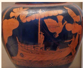
Ulises y la sirenas