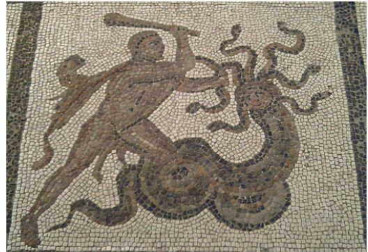
Heracles vence a la Hidra de Lerna

Los relatos mitológicos ayudaban a comprender el mundo y sus misterios. Justificaban jerarquías e instituciones. Transmitían valores y regulaban la conducta. Además, estos relatos revisten un especial atractivo. Están dotados de una alta fuerza emocional . No nos debe extrañar que los mitos fuesen tan importantes para los griegos antiguos puesto que la mayor parte de su vida estaba vinculada con ellos.