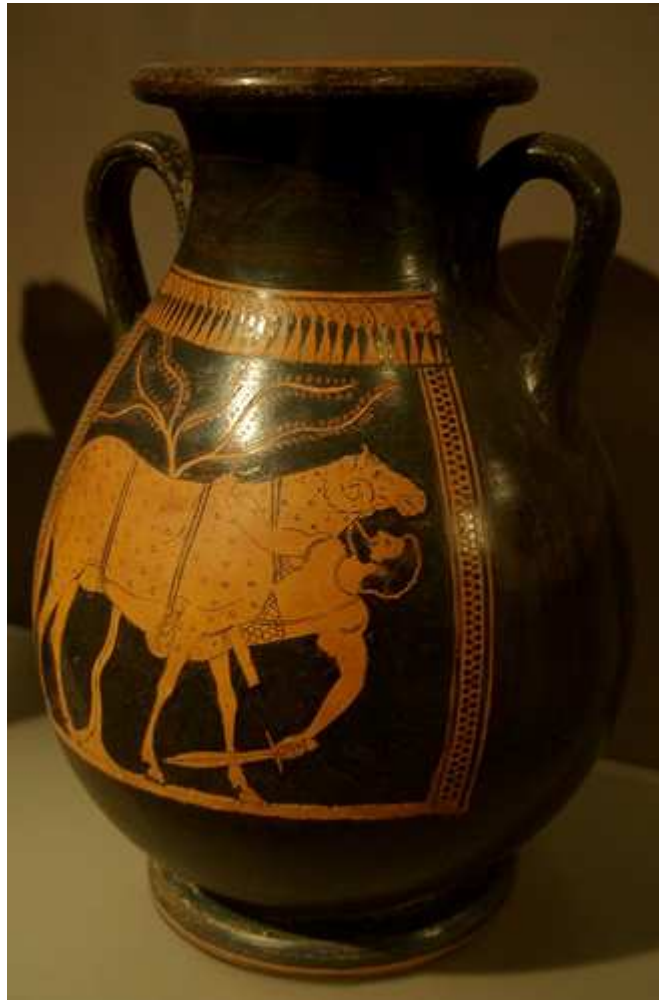
Odiseo escapando de Polifemo

Interesante fotografía, ¿no? ¡Qué curiosa posición! Un hombre atado a un carnero. Si estás atento más adelante lo encontrarás de nuevo atado pero esta vez a un mástil. ¿Qué puede tener que ver con nosotros? Si te digo que es Ulises , que está escapando del Cíclope, que el Cíclope era un ser gigantesco con un solo ojo aficionado a comer carne humana... Si te cuento todo eso seguro que piensas que ese no es nuestro mundo. Pues no, no lo es. Ese es el mundo del mito . Mundo que en la antigüedad griega se tomaban muy en serio. En este tema haremos un recorrido por los elementos fundamentales del mundo mítico griego.