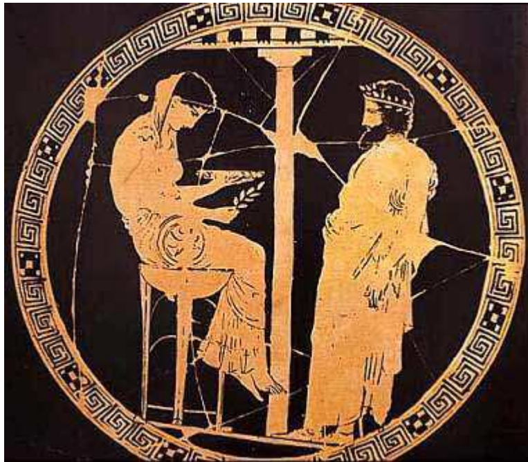
La Pitia en trance

Como hemos visto en el apartado anterior los mitos son capaces de explicar la realidad . Pero lo hacen de una manera un tanto especial. Estoy casi seguro de que no te convence la explicación que da el mito de Perséfone sobre el origen de las estaciones. ¿Qué hay en ese modo de explicar que ya no nos vale? Bien eso es lo que vamos a analizar en este apartado.