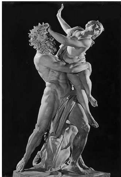
Hades raptando a Perséfone

Cuando escribo esto es invierno. Un invierno duro como hace años no se veía. Pero con toda certeza podemos afirmar que las nieves del invierno dentro de unos meses darán paso a las temperaturas suaves de la primavera. Y unos meses después llegarán los rigores del verano. Al que sucederán los días del otoño que se empeñan en arrancar las hojas a los árboles. Y sin darnos cuenta desembocaremos de nuevo en el invierno. Y así año tras año. No sé si te habrás preguntado de dónde viene este curioso ciclo . Pues los antiguos griegos ya se lo preguntaron. Y se dieron una explicación para ello.