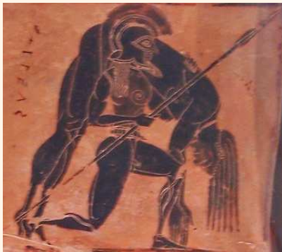
Ajax retira a Aquiles