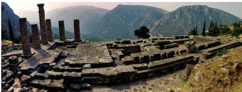
Oráculo de Delfos

Una de las instituciones más importantes que sostenía el pensamiento mítico y trazaba un punto entre lo divino y lo humano eran los oráculos. El oráculo es la respuesta que el dios da a una petición humana . En el caso de Delfos la respuesta se producía a través de las sacerdotisas consagradas a Apolo. Colocada sobre el trípode la Pitia , nombre que deriva de la fabulosa serpiente Pitón que atemorizaba a los hombres en aquellos lugares antes de que Apolo acabase con ella, respiraba unos vapores que le hacían entrar en trance. Su respuesta ininteligible era recogida por los sacerdotes del templo quienes la trasladaban al interesado. De esta forma el dios daba satisfacción a las demandas de conocimiento que partían de los hombres que llegaban allí como particulares o en representación de su polis . Este no fue el único oráculo que existió en la antigua Grecia pero sí el más importante.