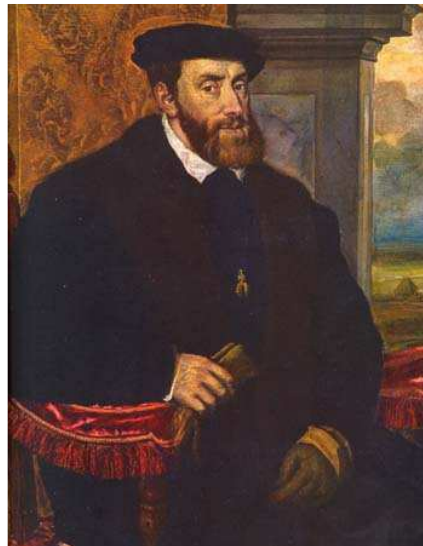
Carlos I, imagen en Wikipedia , dominio público