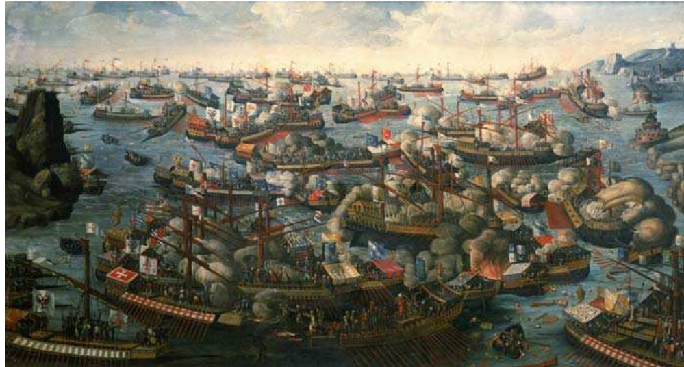
Batalla de Lepanto