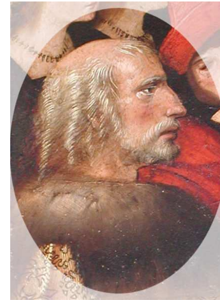
Cristóbal Colón, imagen en Wikipedia , dominio público