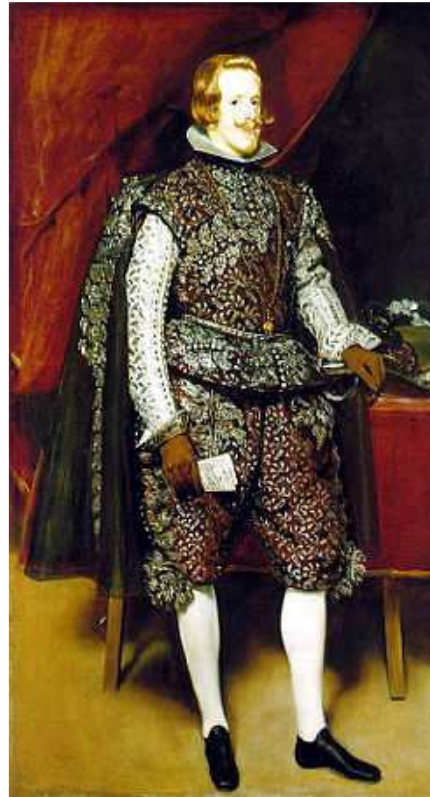
Felipe IV, imagen en Wikimedia Commons , dominio público