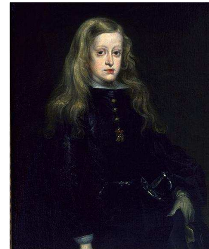
Carlos II, imagen en Wikimedia Commons , dominio público