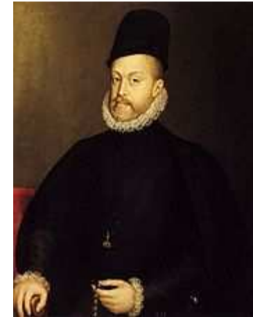
Felipe II