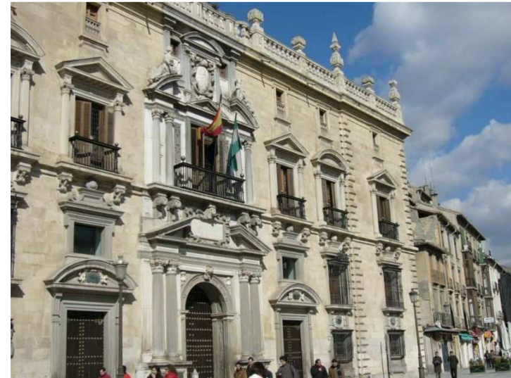
Sede de la Chancillería de Granada, imagen en Wikipedia , dominio público