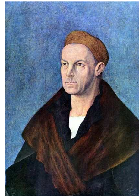
Jakob Fugger, retratado por Durero, fue el principal prestamista de Carlos I.