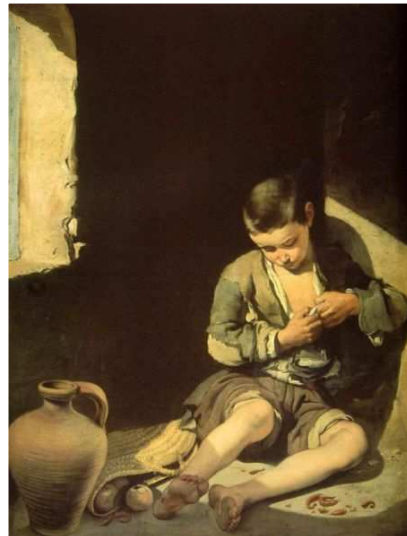
El mendigo. Obra del pintor Murillo hacia 1645. Imagen en Wikimedia Commons . dominio público