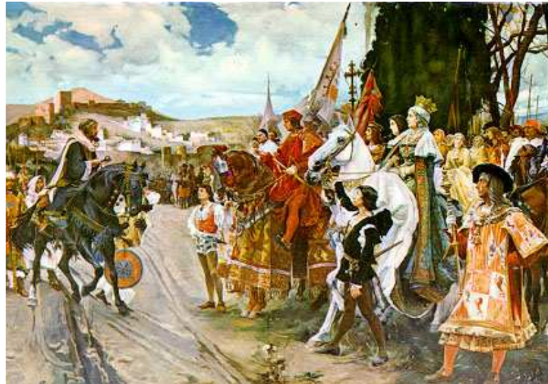
Rendición de Granada, imagen en Wikipedia , dominio público