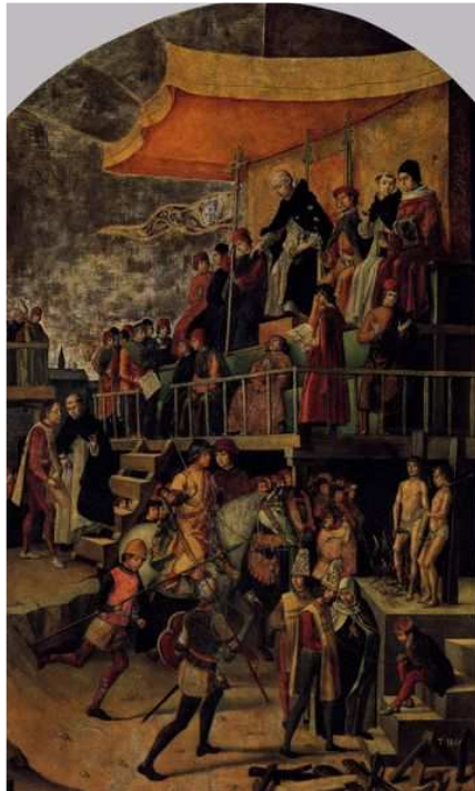
Auto de fe pintado por Pedro Berruguete en 1475, imagen en Wikimedia Commons , dominio público.