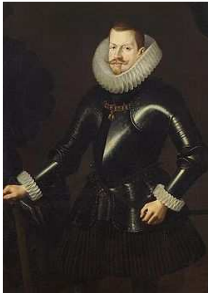
Felipe III, imagen en Wikimedia Commons , dominio público