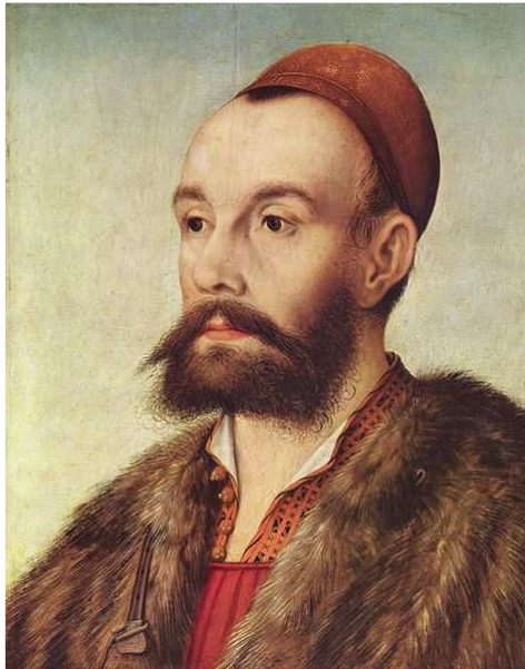
Antón Fugger, prestamista oficial de Felipe II, se convirtió en el hombre más rico de Europa.