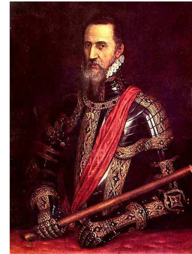
Fadrique Álvarez de Toledo, duque de Alba. Imagen en Wikimedia Commons . dominio público