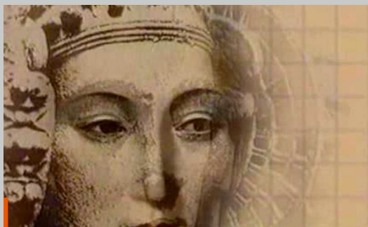
Mujeres en la historia - María de Zayas, una mujer sin rostro

Si quieres saber más sobre esta escritora te invitamos a ver este documental de RTVE sobre su figura: