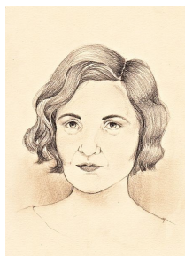
Imagen Carmen Laforet

La nómina de escritoras españolas en las actualidad es verdaderamente interminable. Señalaremos a algunas y sirva como ejemplo de otras tantas que dedican su vida a las letras.