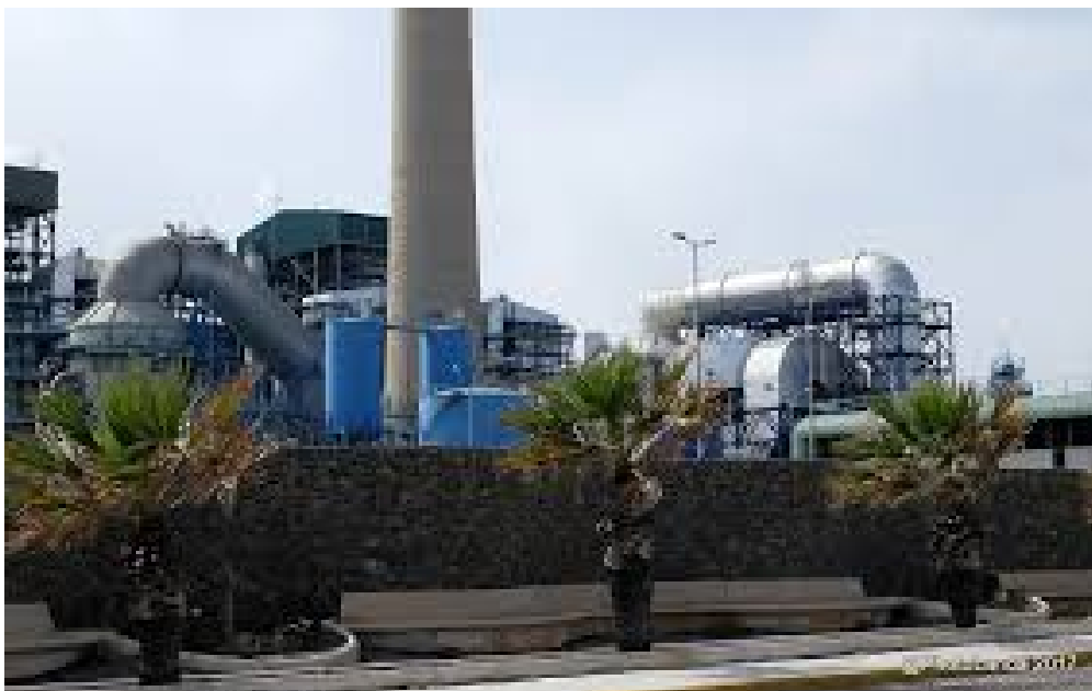
Central térmica Endesa en Carboneras Almería.

Según la Agencia Europea de Medio Ambiente, Endesa es la empresa más contaminante de Andalucía. Su planta de producción en Carboneras triplica la emisión de óxidos de azufre a la segunda en la lista (la central térmica de A Boño, en Gijón) y la emisión de partículas es de más del doble que la de ésta. Los ecologistas de greenpeace acusan a la empresa de estar detrás de 111 muertes prematuras al año y provocar costes por valor de 423 millones de Euros.