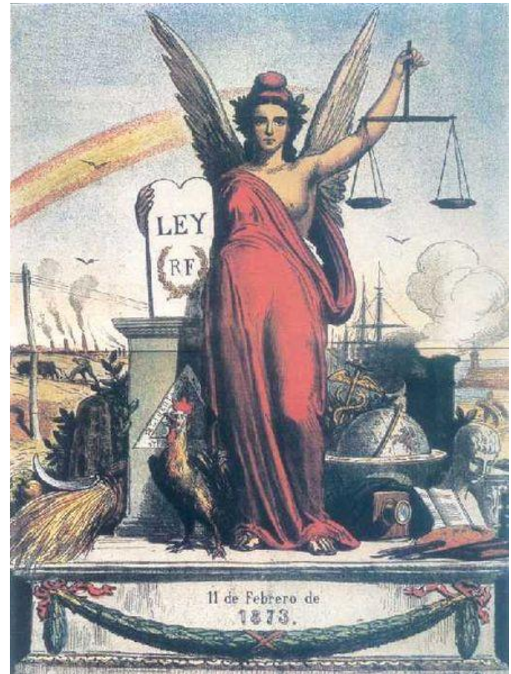
Alegoría de la I República