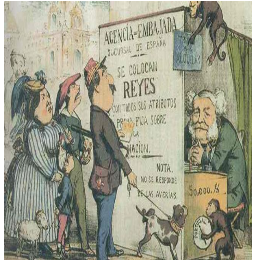
Sátira que muestra a la familia real española buscando trabajo tras revolución de 1868.