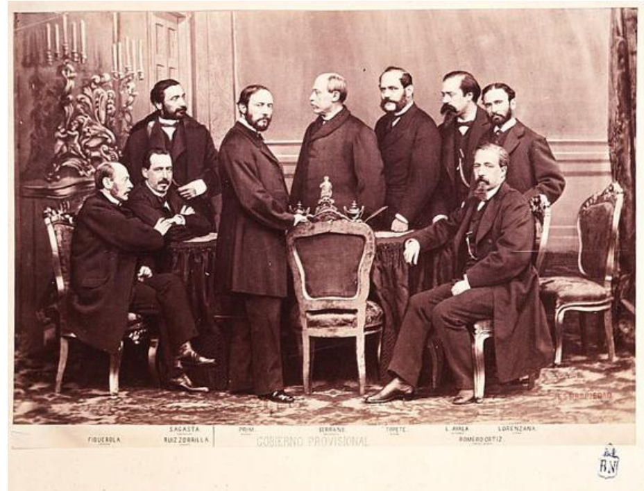
Imagen de los componentes del gobierno provisional formado tras la revolución.