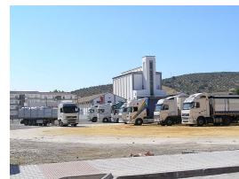
Imagen 3.

El activo no corriente se divide en tres grandes submasas: