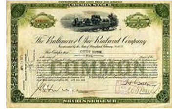
Imagen 6.

Esto es, la empresa no utiliza estos derechos para producir sus bienes sino que invierte en otras empresas, bien prestándoles de formas diversas o bien convirtiéndose en socio mediante la adquisición de acciones. En cualquier caso la empresa pretende la obtención de una rentabilidad por sus inversiones, bien de renta fija, bien de renta variable. Algunas modalidades de inmovilizado financiero son: