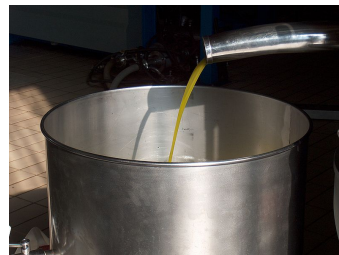
Imagen 14.

Un ejemplo de esta problemática lo encuentras en las existencias, en concreto cuando mercancías iguales están entrando a distintos precios: no habría ningún tipo de problema si se pudiera identificar que existencias están saliendo. Pero con frecuencia es imposible de determinar el precio al que compramos las mercancías que salen.