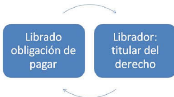
Imagen 9. Elaboración propia