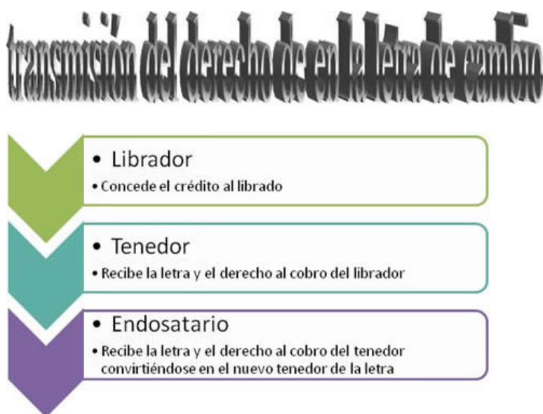
Imagen 10. Elaboración propia

Este vídeo de la universidad de San Marcos de Perú te puede ayudar también a entender la letra de cambio: