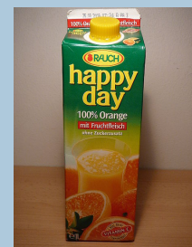
Imagen 5.

Cuando se crearon los envases de tetrabrik, por la compañía Tetrapack muchísimos productores quisieron comprar este envase, mas barato y de alta calidad. Gracias a su innovación, Tetrapack obtuvo unas ganancias cuantiosas y llegó a tener 50 plantas de producción. Puedes completar esta historia en: www.tetrapack.com