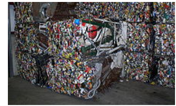
Imagen 7.

Una empresa comercial trabaja con mercaderías , compra y vende productos sin transformarlos. Por otro lado, una empresa del sector secundario, es decir una industria o empresa transformadora, genera productos terminados con el empleo de materias primas .