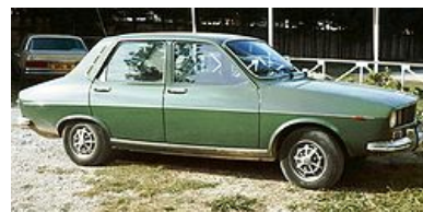
Imagen 12.

Valor Neto Realizable = 6.000 € - 1.000 € = 5.000 €