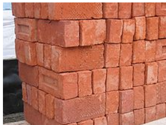
Imagen 13.

Como hemos visto anteriormente el coste de producción y el precio de adquisición son los criterios más utilizados, por su objetividad y facilidad de cálculo. Aun así, en numerosos casos, surgen problemas al concretar estos criterios que hay que resolver dando una respuesta a cada dificultad que se plantea.