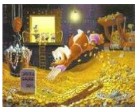
Imagen 11.