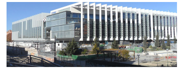
Imagen 4.