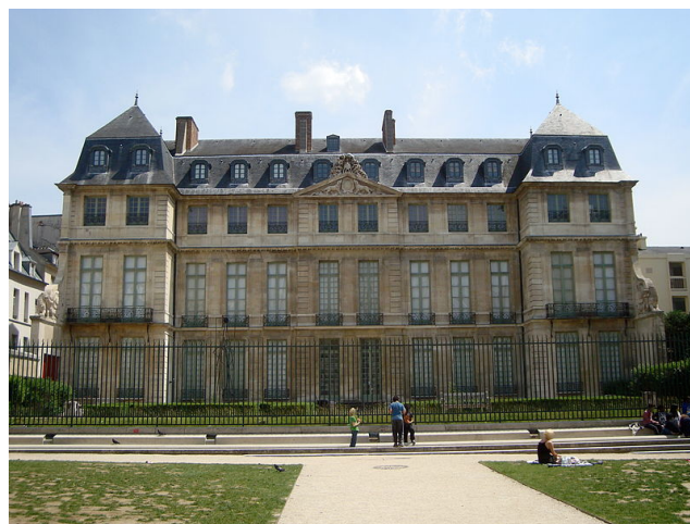
Le musée Picasso à Paris

Espagnol d'origine (il est né à Malaga), Picasso a passé une grande partie de sa vie en France. Avec ce musée, la France rend hommage à l'homme que l'on considère, avec l'expression utilisée par le président français François Hollande lors de la réinauguration, « orgueil de la France ».