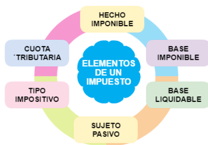
Elementos de un impuesto Diagrama de elaboración propia