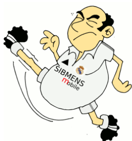
Fútbol e IS Animación de elaboración

Son muchas las noticias que salen en los medios de comunicación sobre el fraude a Hacienda en el mundo del deporte y más concretamente, en el fútbol. Son varios los clubes y futbolistas de renombre que se han visto salpicados por estos escándalos.