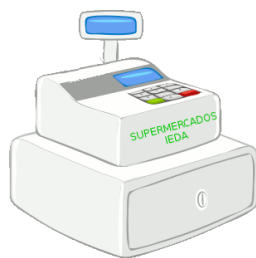
Tipos de IVA Animación de elaboración propia

porcentajes, pero en realidad es algo que hacemos casi mecánicamente.