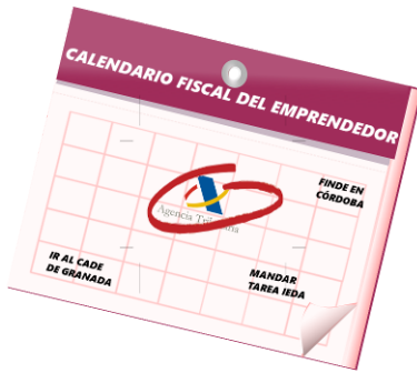
Calendario fiscal Diagrama de elaboración propia

Ya has visto que como emprendedor te enfrentas a numerosos tributos y la mayoría de ellos tienen cuotas periódicas u otras obligaciones. Aunque ya se pueden presentar por internet, simplificando enormemente la tarea, hay muchas fechas que son importantes y que no debes dejar pasar en tus obligaciones fiscales.