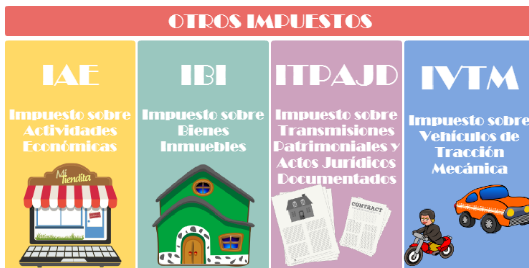
Otros impuestos que afectan a personas físicas y personas jurídicas Diagrama de elaboración propia

Los impuestos que has estudiado son los más importantes por su volumen de recaudación y también son los que más afectan a los empresarios. Pero hay otros que aunque menos importantes, también debes conocer: