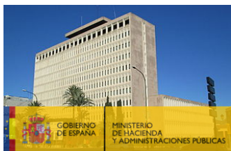
Delegación de Hacienda en Málaga

Fotografía de Tyk en Wikimedia Commons . Licencia CC . Logotipo en Wikimedia Commons . Licencia Dominio Público