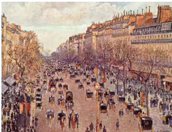
Imagen de Camille Pissaro bajo Licencia CC