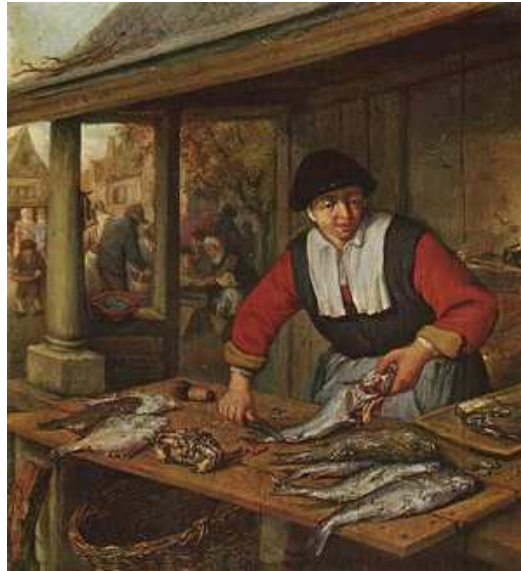
Imagen de Adriaen van Ostade bajo Dominio público

"En estas niñeces pasé algún tiempo aprendiendo a leer y escribir. Llegó (por no enfadar) el de unas Carnestolendas, y trazando el maestro de que se holgasen sus muchachos, ordenó que hubiese rey de gallos. Echamos suertes entre doce señalados por él y cúpome a mí. Avisé a mis padres que me buscasen galas.