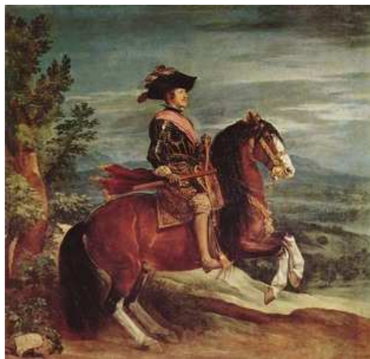
Imagen de Diego de Velázquez bajo Dominio público

El siglo XVII es de una profunda crisis para toda Europa, aunque en España reviste una extrema gravedad. Para nuestro país es, además, el siglo de la decadencia. Desde el reinado de Felipe II se observa esta evolución que se hace patente en los gobiernos de Felipe III , Felipe IV y Carlos II . La corrupción y la inoperancia de los gobernantes, junto a las derrotas bélicas y la Paz de los Pirineos en 1659, hacen que España pierda la hegemonía en Europa, cediéndola a Francia.