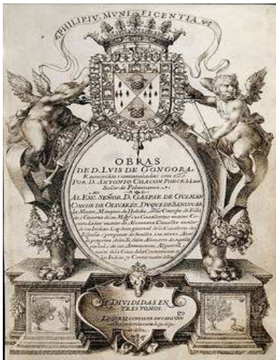
Imagen de Antonio Chacón bajo Dominio público

La obra del poeta no pasó desapercibida en ningún momento. Desde sus seguidores más inmediatos hasta los grandes revitalizadores del poeta cordobés, la Generación del 27, su producción ha sido tanto vilipendiada como elogiada. El hermetismo de la vida de Góngora coincide con la necesidad, preconizada por Ortega y Gasset , de mantener rigurosamente alejadas vida y literatura, así como la absoluta preponderancia de la técnica sobre el sentimiento.