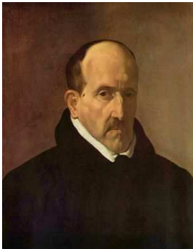
Imagen de Diego de Velázquez bajo Dominio público

Luis de Góngora es el máximo exponente de la poesía culterana , corriente estilística que cultiva la forma para crear belleza e impresionar los sentidos del lector con estímulos de luz, color y sonido.