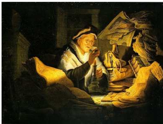
Imagen de Rembrandt bajo Dominio público