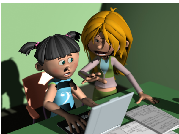
Dos chicas estudiando

6º) Detallar la bibliografía del trabajo, es decir, todos los lugares de los que has obtenido la información.