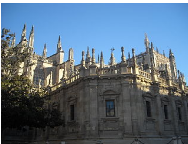
Pináculos de la Catedral de Sevilla

Lo ideal sería que cada palabra de las que se encuentra en el diccionario tuviera solamente un significado. En ese caso solo tendríamos palabras monosémicas . Pero la lengua es inteligente y para ahorrar trabajo a la hora de memorizar nos ofrece la posibilidad de obtener varios significados con un único término. Son las palabras llamadas polisémicas . Sabremos cuál es el significado concreto de una palabra por las demás que la acompañan o por el contexto. Por ejemplo, la palabra monumento dicha ante la catedral de Sevilla significa "monumento artístico-histórico"; sin embargo, si vemos pasar a un chico o una chica muy guapos y pensamos: ¡qué monumento! , no nos referimos a la Historia del Arte, ¿no te parece?