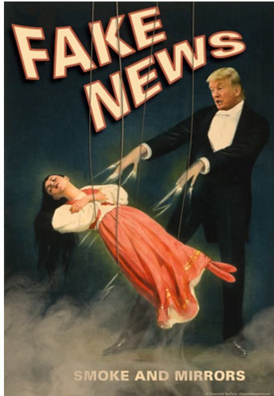
Trump's Fake News