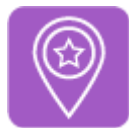
Imagen de Picho76 en WikimediaCommons . Licencia CC