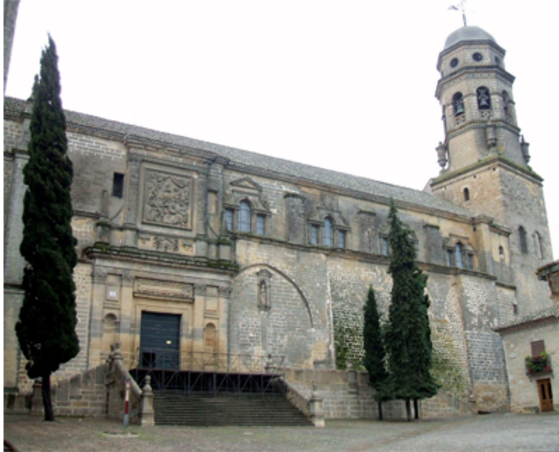
Catedral de Baeza (Jaén)

Estamos saliendo de una catedral de la Edad Media, pero lo vamos a hacer poco a poco a lo largo de esta unidad. Seguimos viendo esa catedral, vemos sus altos muros aún, su intento de agradar a Dios, recordamos el recogimiento en su interior, la postración de los fieles, arrodillados ante Dios. Pero vamos saliendo de ella. Nos vamos a encontrar con una naturaleza que iremos descubriendo que funciona como una máquina, tendremos que estudiar sus leyes, su movimiento. Alguien nos irá diciendo que el ser humano es el centro del Universo, que es importante, pero que está en un Planeta que no es el central, sino que gira alrededor del Sol. Y no será fácil que asumamos estas nuevas situaciones.