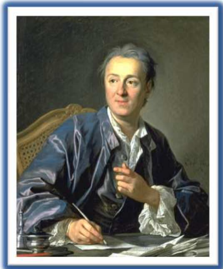
Diderot, imagen en Wikipedia , dominio público