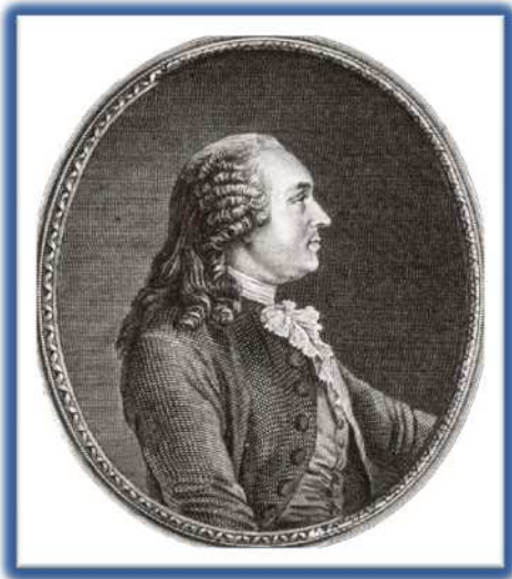
Turgot, imagen en Wikipedia , dominio público