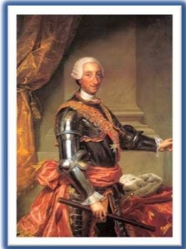
Carlos III de España.