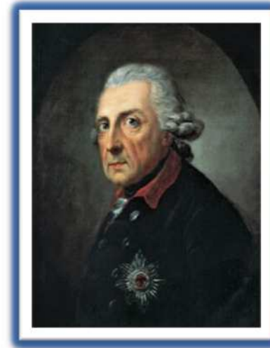
Federico II de Prusia.