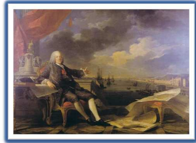
Pombal, imagen en Wikipedia , dominio público