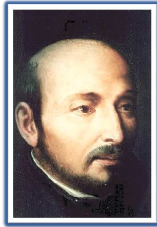
San Ignacio de Loyola