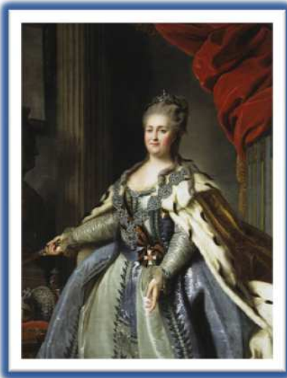
Catalina II de Rusia.