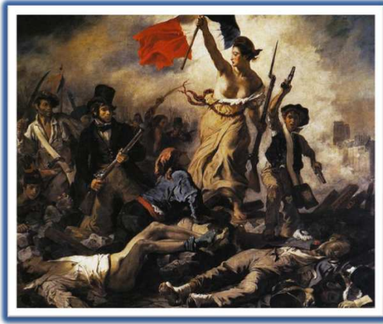
La libertad guiando al pueblo, Delacroix. Imagen en en Wikipedia , dominio público