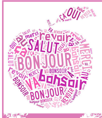
Imagen de elaboración propia