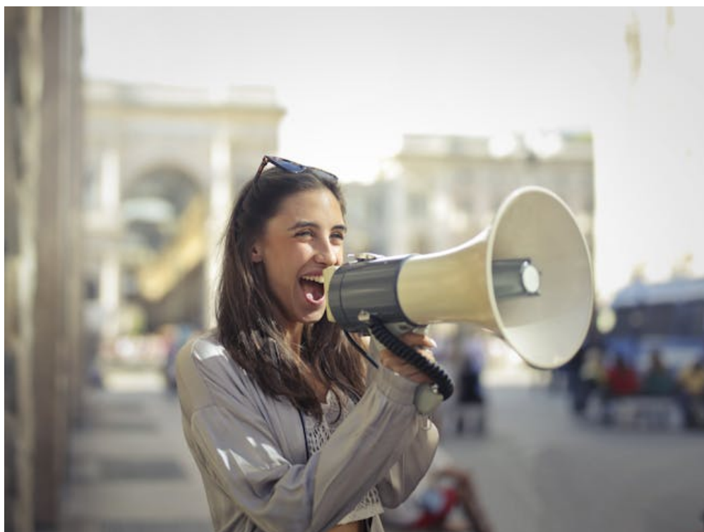
Imagen de Andrea Piacquadio en Pexels < https://www.pexels.com/es-es/@olly/ > . Joven alegre < https://www.pexels.com/es-es/foto/mujer-joven-alegre-gritando-en-megafono-3761509/ > (Licencia Pexels < https://www.pexels.com/es-es/license/ > )

Con esta situación de aprendizaje y reto hemos aprendido que la Morfología —cómo se forman y se combinan las palabras— no es solo teoría: nos ayuda a expresarnos con más claridad, corrección y respeto. Entre otras cosas, hemos analizado los préstamos lingüísticos para valorar cuándo enriquecen el idioma y cuándo conviene evitarlos, y hemos reflexionado sobre cómo el uso adecuado del lenguaje mejora nuestra credibilidad y demuestra civismo.