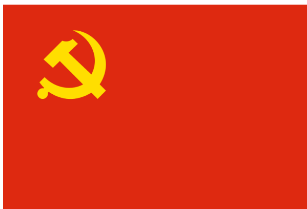
Un sistema centralizado: el de los países comunistas