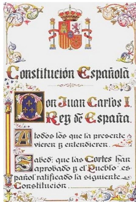
Constitución Española de 1978