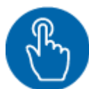
Imagen de Infinauta en Wikimedia Commons . Dominio público