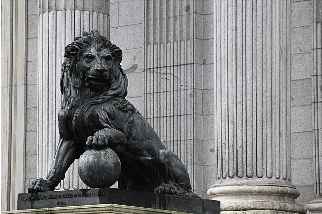
León del Congreso de los Diputados

Los leones del Palacio de Congresos son dos esculturas de bronce que protegen la entrada a las Cortes. Están realizados por Ponciano Ponzano y reciben el nombre de Daoíz y Velarde , los héroes del Dos de Mayo.