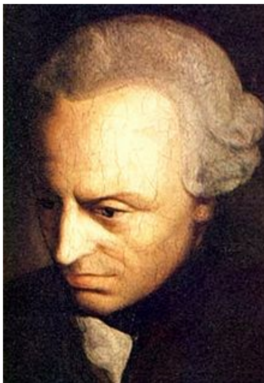
Retrato de Immanuel Kant

Nos hemos referido al proceso al comienzo del tema: la Ilustración , que al decir de Kant es «la salida del hombre de su culpable minoría de edad», comienza a desarrollarse con fuerza en toda Europa. Sin embargo, no en todos los países pasarán por este proceso con la misma velocidad y profundidad. Quizás podamos decir que el Sacro Imperio (Alemania) y Francia son los representantes más cualificados del movimiento. Inglaterra había seguido desde el siglo XVI su propio camino; estas diferencias podrían sintetizarse en la oposición filosófica entre racionalistas y empiristas, que sólo con Kant, a finales del siglo XVIII, harán parcialmente las paces. Sin duda, el arranque del movimiento debe buscarse un siglo atrás, en la época de René Descartes . En Alemania será Leibniz el representante más destacado del racionalismo, aunque incluso en el XVII se perciben en el Imperio Germánico tendencias irracionalistas, que posteriormente se desarrollarán en el Romanticismo. En las Islas, por su parte, encontraremos a J. Locke y a D.Hume como los más nítidos representantes del empirismo.