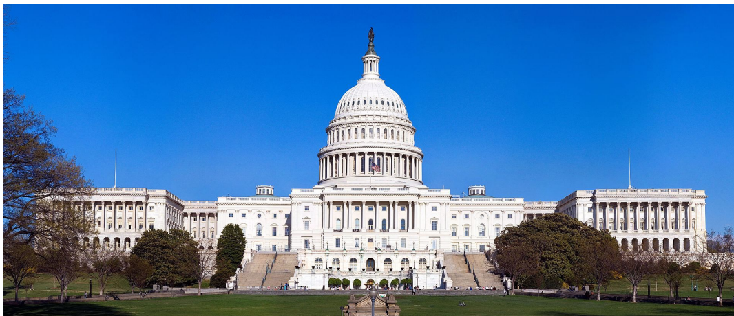
Capitolio de Washington

En Estados Unidos el Capitolio de Washington se encuentra entre las grandes obras del Neoclásico. Fue terminado en 1800 y diseñado, en primer lugar, por William Thornton, más tarde, participaron en su construcción Benjamin Henry Latrobe, Charles Bulfinch y Thomas U. Walter. Llama especialmente la atención su enorme cúpula y los dos anexos a cada uno de los lados. La Rotonda es el centro del Capitolio y en ella se encuentra una gran colección de arte. Arriba de ella se encuentra la majestuosa cúpula, muy elevada y sobre un doble tambor. En el edificio se puede ver la influencia del Neoclásico europeo como las obras parisinas más arriba comentadas y, por supuesto, edificios de la Antigüedad clásica como el Panteón de Agrippa.