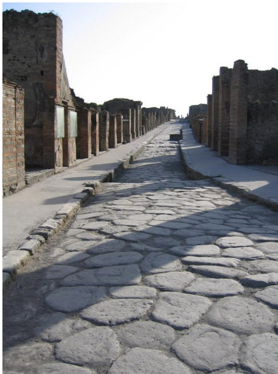
Calle de Pompeya

Como hemos dicho, los cambios sociales, políticos y religiosos habían traído una nueva sensibilidad , que se expresará con lo que nosotros damos en llamar neoclasicismo . Sin duda, los «excesos barrocos»—y ese ápice al que nos referimos como rococó—contribuyeron al nacimiento de una no tan nueva sensibilidad estética, porque se trataba, en definitiva, de volver la vista atrás, como en el Renacimiento , a la Antigüedad Clásica para encontrar el modelo de arte racional de acuerdo con los presupuestos ilustrados. Sin duda, los descubrimientos arqueológicos (Herculano, Pompeya) contribuyeron al giro neoclásico. Por eso, también se puede entender este estilo como un volver al Renacimiento para, desde él, alcanzar las ideas claras y distintas de la Antigüedad. Un arte, en definitiva, que se quiere apolíneo y rechazará todo exceso . Quizás podamos hablar, si se me permite, de un arte zombi , porque en más de un sentido está muerto: se trata de imitar y en muchas ocasiones parece faltar todo calor de la vida, la confusión y la sobreabundancia de sentimientos. Sabemos ya que la Ilustración vio dos cumbres—la Antigüedad y el Renacimiento—: lo que quedaba entre ellas era, sencillamente, lo que estaba «en medio», es decir, la Edad Media, identificada con la oscuridad, la falta de medida y el exceso. El barroco fue puesto en esa misma línea y representaba, además, el arte del detestable absolutismo .