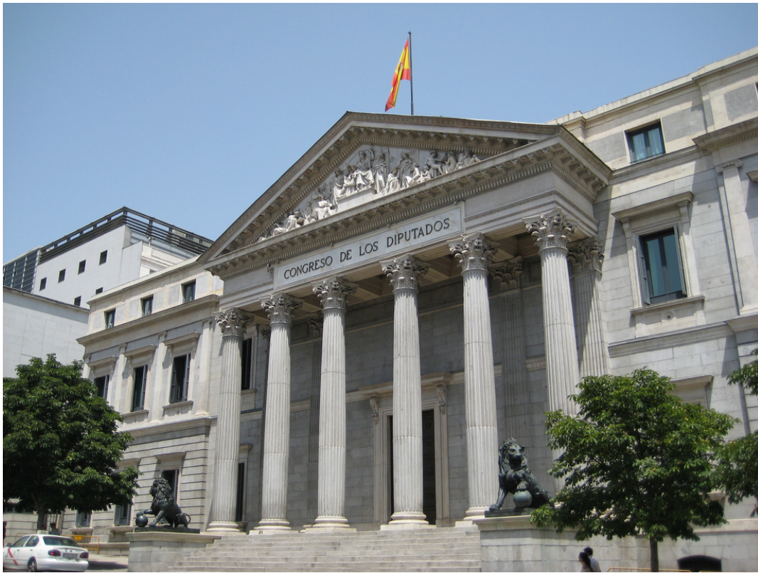
Palacio de la Cortes