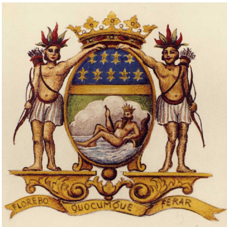
Escudo de la Compañía francesa de las Indias orientales

Por otro lado, en 1664 la Compañía francesa de las Indias Orientales , también la alemana y la inglesa, acaba con el "monopolio" de españoles y portugueses comenzando la gran explotación de los territorios conocidos como indias orientales. Estas compañías se crearon para unir a los comerciantes que hacían negocios en Asia, se hicieron muy poderosas e incluso llegaron a ejercer cierta influencia política. Hubo también quienes se admiraron del arte y la cultura de estos lugares. No cabe duda de que todo esto tiene una enorme influencia en la Europa de estos siglos.