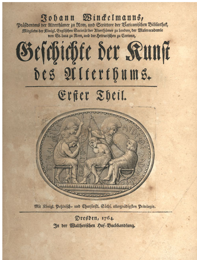
Portada de Historia del Arte de Winckelmann