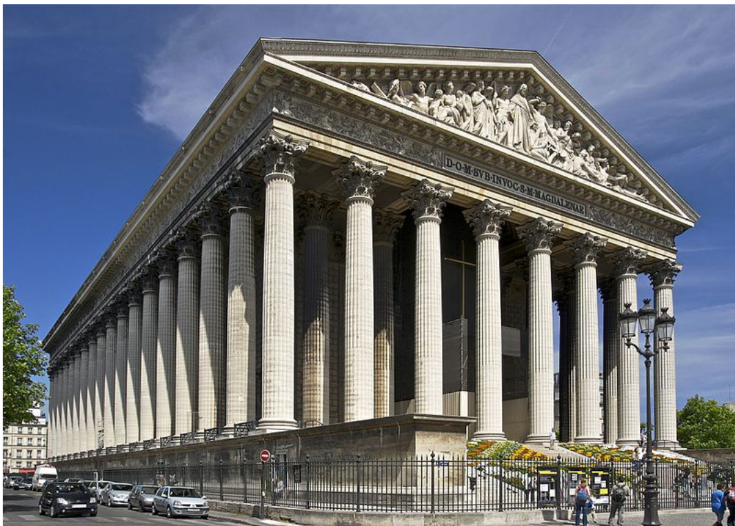
Iglesia de la Magdalena

Empecemos por Francia, como decimos, el centro y la cuna de este estilo. Aquí llama especialmente la atención la iglesia de la Magdalena que fue ordenada construir por Napoleón como homenaje al gran ejército francés. Es muy fiel a los cánones clásicos, de hecho, puede ser considerada un templo corintio, con clara inspiración del Maison Carée de Nîmes. Guillaume Couture realiza los planos y es construida por Pierre Contant d'Ivry con una interrupción importante debido a la Revolución Francesa.