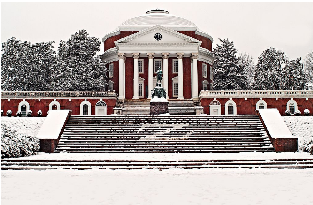
La Rotonda, Universidad de Virginia

La Casa Blanca de Whashington diseñada por James Hoban es también claramente de influencia palladiana y un ejemplo de arquitectura neoclásica en su facha sur.