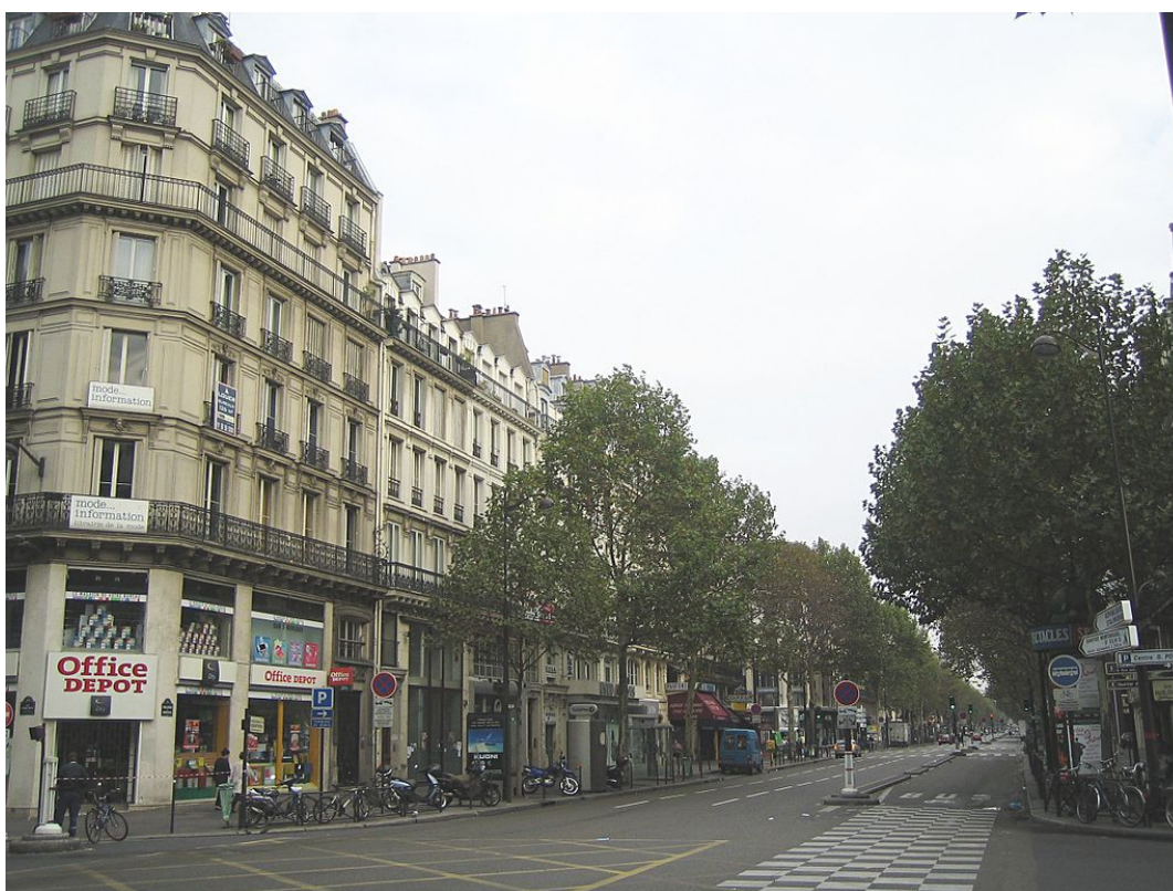
Bulevar de Sebastopol

París era aún una ciudad medieval aunque había crecido enormemente, por lo que se hacía notar la congestión del tráfico y ciertos problemas de higiene . Las primeras obras comienza con Napoleón I, por ejemplo, la construcción de la rue de Rivoli , pero fue con Napoleón III con el que se llevaron a cabo las obras más importantes: la construcción de las grandes avenidas para dar acceso al tráfico de la ciudad. Además, se quería dar imagen de gran ciudad europea , con enormes espacios y lugares simbólicos. Para ello Napoleón III encarga al prefecto de París, el barón Haussmann , un gran proyecto que acabó con la ciudad medieval.