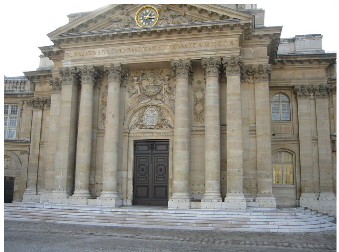
Real Academia de Bellas Artes de París

Andrea Palladio (1508-1580) fue un arquitecto renacentista italiano conocido especialmente por algunas de sus obras como las villas. Se habla del “ palladianismo ” como un estilo autónomo que llegó hasta finales del siglo XVIII . En el Reino Unido destacan Cristopher Wren e Iñigo Jones . Algunos ejemplos como la Holkham Hall en Norfolk. En Estados Unidos citamos La Rotonda de la Universidad de Virginia y la Casa Blanca . Entendemos por estilo imperio el momento en que se produjo la enorme transformación de París durante el Segundo Imperio . París era aún una ciudad medieval . Napoleón III con el que se llevaron a cabo las obras más importantes: la construcción de las grandes avenidas . También se construyeron grandes estaciones de tren y la Ópera de Garnier . La arquitectura neoclásica tiene su epicentro en Francia . Destacamos grandes edificios neoclásicos: iglesia de la Magdalena en París , Palacio de Congresos en Madrid y Capitolio de Washington .