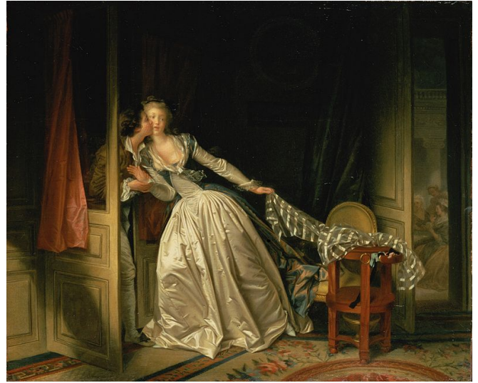
El beso robado, Fragonard