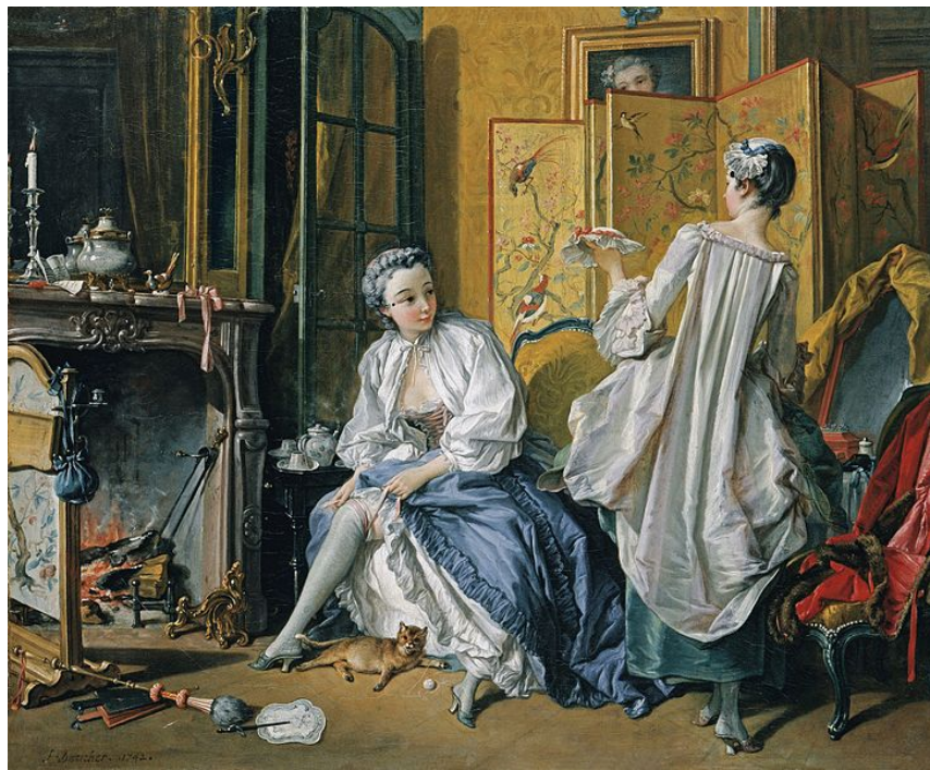
La toilette, Boucher