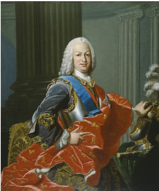
Fernando VI, Van Loo

Su hermano por parte de padre, Carlos III , llegó desde Nápoles en donde reinaba para suceder a Fernando VI. Sus aires renovadores acarrearón la oposición de la nobleza y los estamentos más tradicionales. Fue continuador de los Pactos de Familia. En esa línea de la modernización también condijo a las artes que fueron acercándose al Neoclasicismo. No obstante no debemos olvidar piezas emblemáticas del rococó como la que veremos posteriormente en el Palacio Real, el Salón Gasparini.