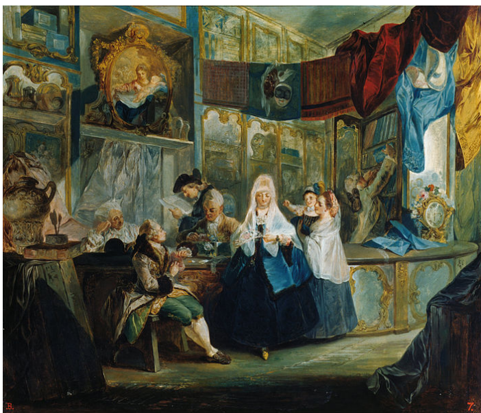
La tienda, Luis Paret y Alcázar

Sin embargo, los temas galantes de Francia no son aquí tan divulgados. Se prefieren las representaciones alegóricas que glorifican a la monarquía en los Palacios Reales o los temas marianos en los frescos de las iglesias, mostrando una imagen más afable de las escenas sagradas que en el Barroco. Los retratos de la época tendrán también un toque diferente, no son tan ceremoniosos sino más humanizados.