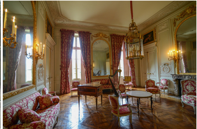
Salón del Petit Trianon, Versailles.