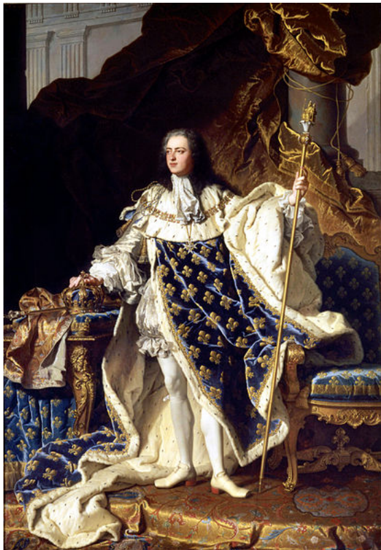
Luis XV, Rigaudeau

El Rococó es un estilo que se inicia en Francia hacia 1720 y apenas duras unos 40 años, coincidiendo con el reinado de Luis XV. Su final se corresponde con la aparición del pensamiento Ilustrado que entendía este arte como algo trivial y depravado.