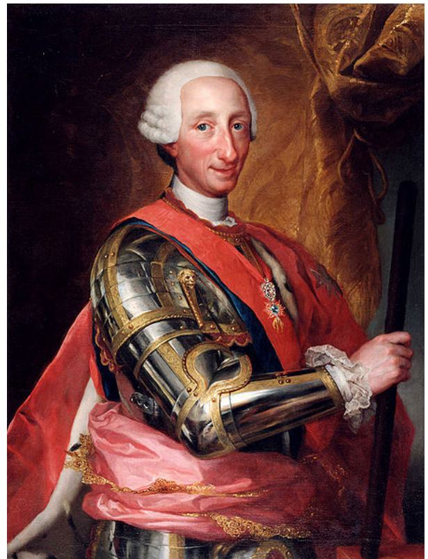
Carlos III, Mengs

Imagen en Wikimedia Commons de dominio público