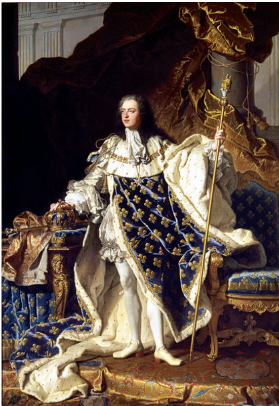
Luis XV, Rigaud

Imagen en Wikimedia Commons . Dominio público