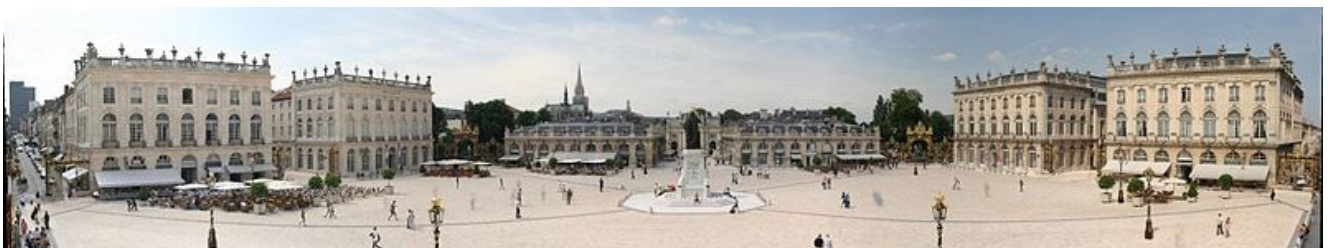
Plaza de Stanislas, Nancy

El otro lugar en donde triunfa el Rococó es en Alemania , con arquitectos de la talla de Baltasar Newman que trabajará en la zona de Bohemia. Allí, en Wurzburg, construirá la Residencia del Obispo elector .