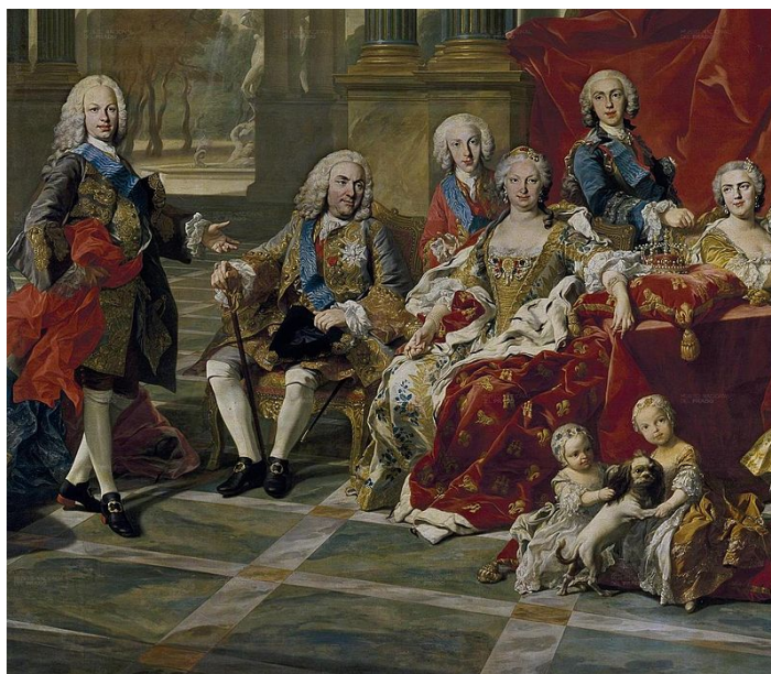
La familia de Felipe V, Van Loo

La entrada del nuevo siglo, el XVIII, trajo bajo el brazo a una nueva dinastía de origen francés, los Borbones, la misma que continúa en la actualidad. Tras la Guerra de la Independencia provocada por la muerte del último de los Austrias, el nieto de Luis XIV, Felipe de Anjou, sube al trono español coronado como Felipe V . Las novedades venidas de Francia no se hicieron esperar y el Absolutismo con su fuerte centralización estatal se instalaron. La situación del monarca fue complicada ya que durante su reinado tuvo que hacer frente a varios problemas. Los que llegaban desde el extranjero, las rencillas con Austria