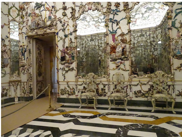
Sala de la porcelana. Palacio de Aranjuez, Madrid.

entusiasta de una decoración animada y distinguida, difundiendo una viveza, delicadeza y belleza llenas de gracia.