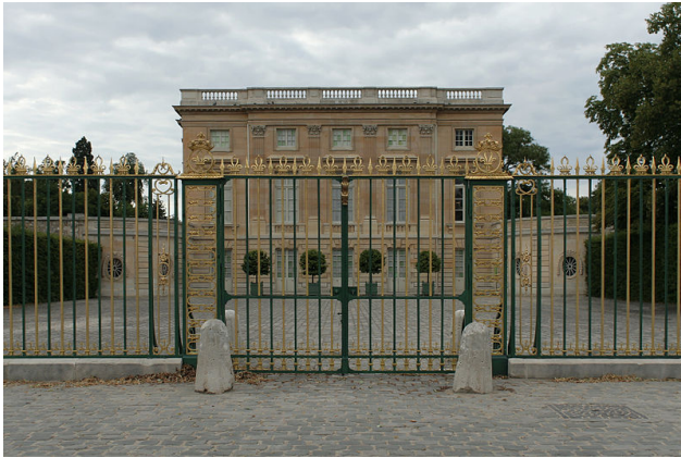
Petit Trianon, Versailles

¿Sabías que dentro de Versalles Luis XV hizo construir un palacio para su favorita Madame de Pompadour? Pues sí, el Petit Trianon construido por Jacques Gabriel fue proyectado con ese objetivo. Sin embargo, Madame de Pompadour no llegó nunca a disfrutarlo porque murió antes de que lo terminaran. Quien sí lo utilizó fue María Antonieta, esposa de Luis XVI, que instaló allí su palacio de verano. Era su lugar favorito para pasar largas estancias, por eso, en contraposición a su fachada de corte palladiano, decoró profusamente su interior, haciendo este proyecto totalmente suyo,