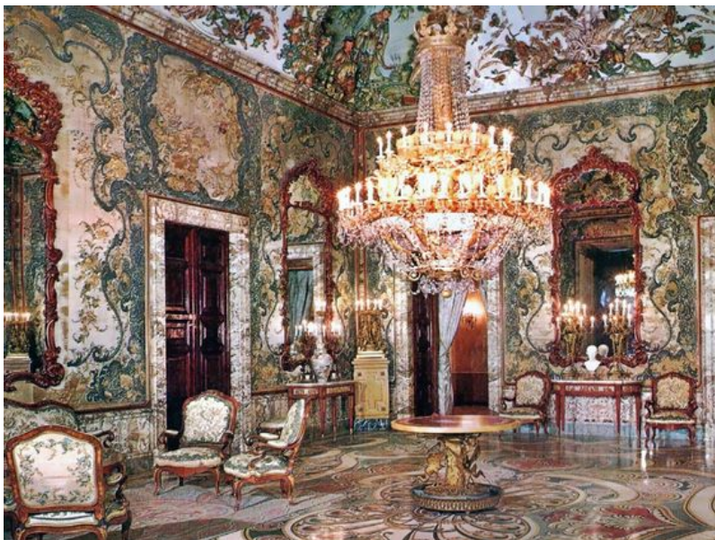
Salón Gasparini, Palacio Real

En Andalucía la arquitectura barroca religiosa evoluciona recargándose cada vez más, esta deriva en el estilo Rococó. Puede que uno de los nombres más relevantes del momento es el del cordobés Francisco Hurtado Izquierdo . Obras como el Sagrario de la Cartuja de Granada lo acreditan.