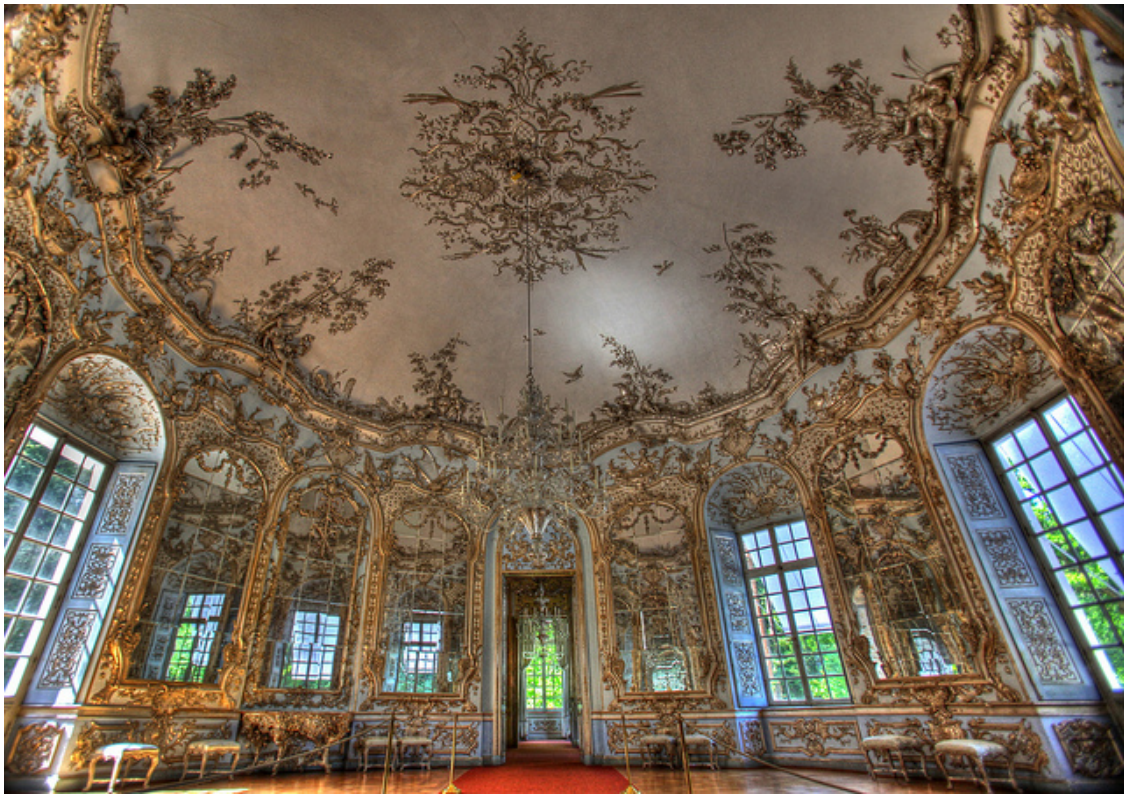
Sala de los espejos, Palacio de Carlos VII y María Amalia de Austria