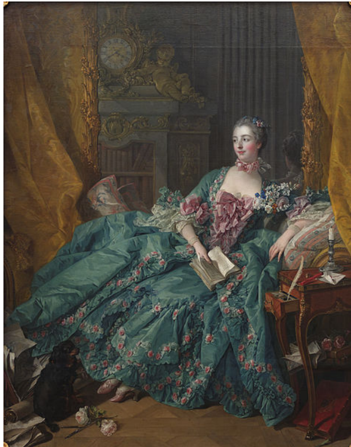
Madame de Pompadour, Boucher Imagen de Yelkrokoyade en Wikipedia . Licencia cc

para la decoración: muebles, joyas, porcelanas... inundaron los palacios del siglo XVIII. A ella se debe la fundación de la fábrica de porcelana de Sévres. Tampoco se le escapó la indumentaria, siendo una incondicional de la moda, dicen que llegaba a cambiarse de vestido varias veces en una jornada.