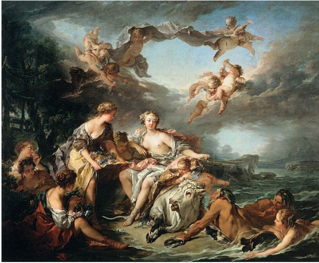
El rapto de Europa, Boucher