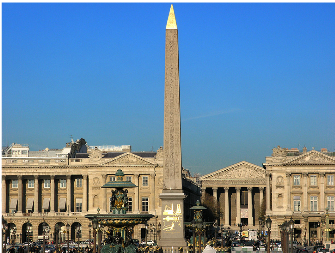
Plaza de la Concordia, París

Algunos de sus edificios en los que puedes ver estas características son el Palacio De Compiègne , la Ópera Real de Versailles , el Hôtel Biron , el Petit Trianon de Versailles o la Plaza de la Concordia en París.