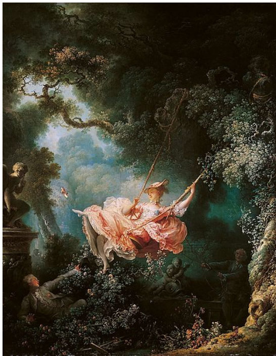
El columpio, Fragonard.

Watteau, junto a Fragonard y Boucher son algunos de los representantes más destacados de la pintura Rococó.