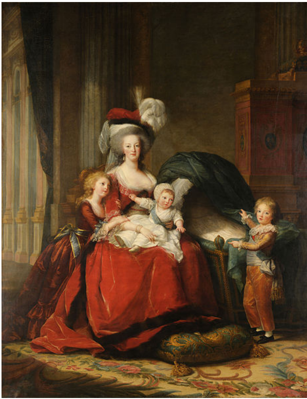
Maria Antonieta y sus hijos, É. Vigée Le Brun

Imagen de Google Cultural Institute en Wikimedia .