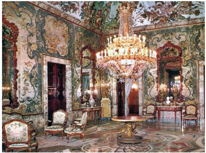
Salón Gasparini, Palacio Real

El gusto rococó se introdujo en España de la mano de la nueva dinastía francesa, los Borbones. Algunos de esos ejemplos más señeros son: El Salón Gasparini del Palacio Real de Madrid , en el Palacio de Aranjuez la Sala de las Porcelanas o el Sagrario de la Cartuja de Granada .