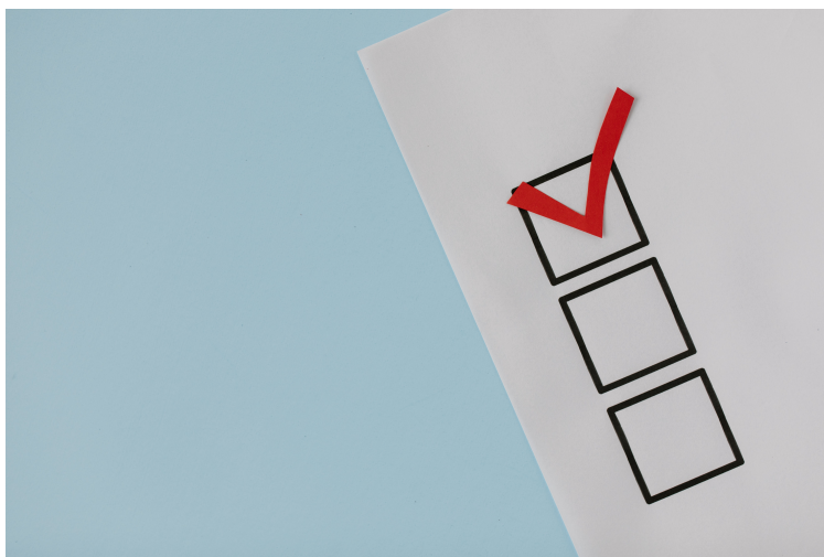
Imagen de Tara Winstead < https://www.pexels.com/es-es/@tara-winstead/ > . Checklist < https://www.pexels.com/es-es/foto/cajas-votacion-marca-eleccion-8850706/ > (Licencia Pexels < https://www.pexels.com/es-es/license/ > )