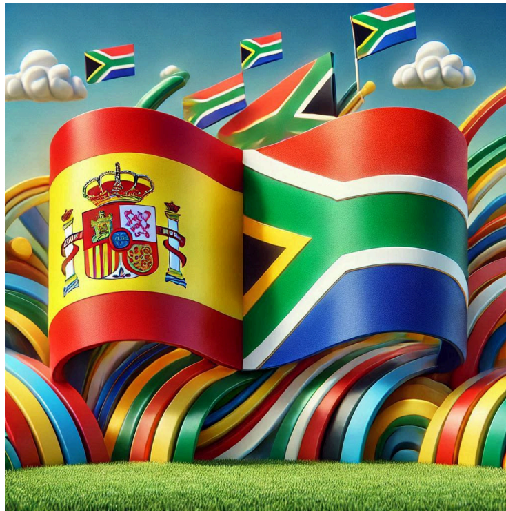
Banderas de España y Sudáfrica

La Cámara de Comercio - World Trade Point Federation - de Johannesburgo, en Sudáfrica, se ha percatado de que crece el número de estudiantes de Económicas que estudian nuestra lengua y cultura como asignaturas de libre configuración; además, muchos empresarios quieren fomentar las relaciones comerciales con las zonas del mundo hispanohablante, que, según el último anuario del Instituto Cervantes, supone un 9% del PIB mundial. Por eso, la Facultad de Comercio, Derecho y Dirección de empresas de la Universidad de Witwatersrand, junto a la Cámara de comercio de España en Sudáfrica, han organizado la I Semana del Hispanismo, a la que hemos sido invitados para formar a futuros profesores sudafricanos de español. También han sido invitados docentes originarios de Lesoto, Madagascar e Islas Mauricio y Comoras.