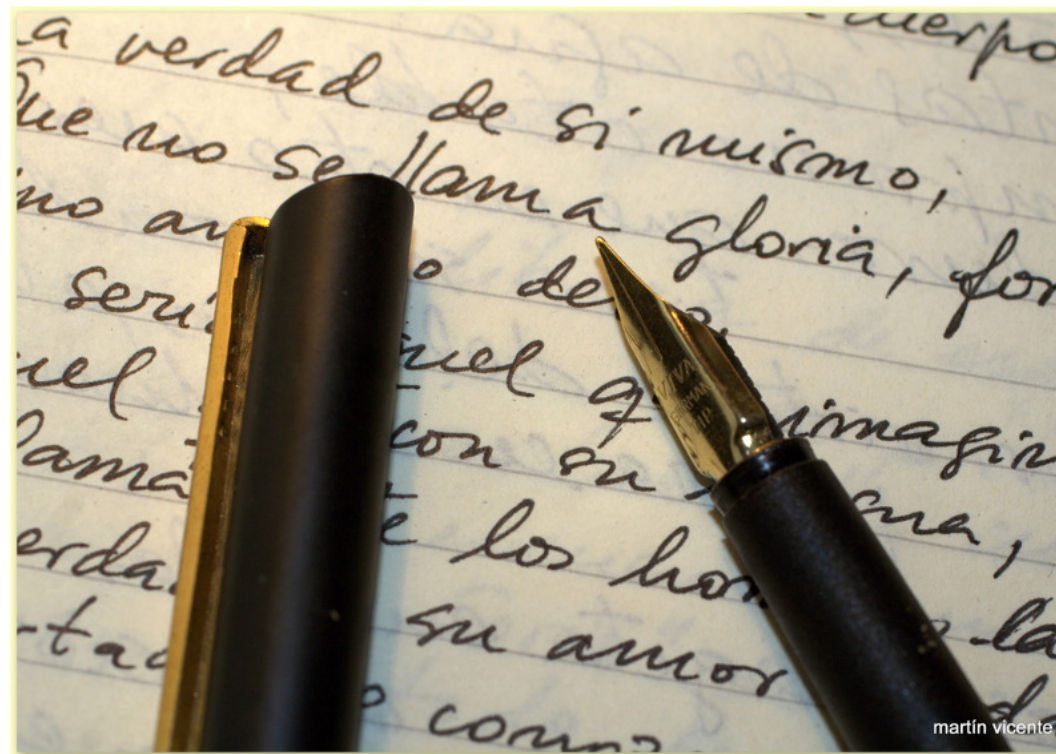
con una Licencia Creative Commons