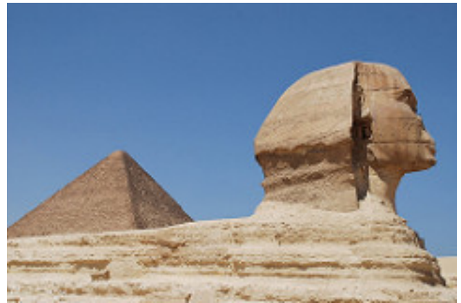
Esfinge y pirámide de Kefrén