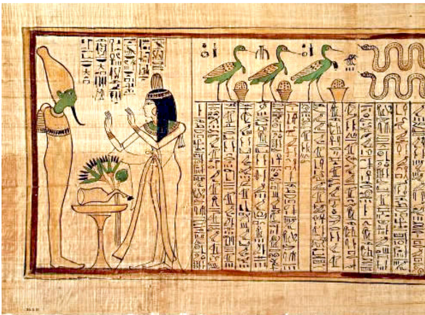
El libro de los muertos