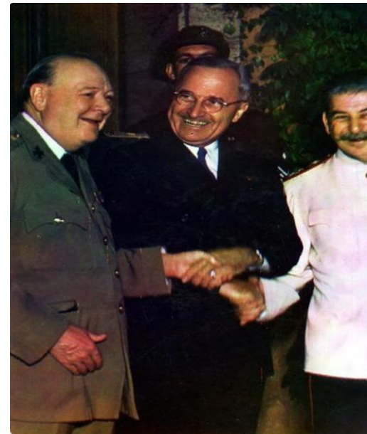
Churchill, Truman y Stalin, los vencedores en wikipedia