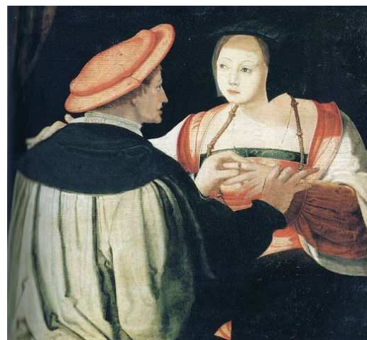
Imagen de Lucas van Leyden bajo Dominio público

Nota común es el desenlace trágico , no solo debido al deseo frustrado, sino también cuando el amor se consume. La acción externa no tiene demasiada importancia en estas obras, pues concentran su atención en el análisis de las emociones, que se describen con lentitud y minuciosidad. Los diálogos son sustituidos por el intercambio de cartas, que sostienen por sí solas todo el peso de las quejas.