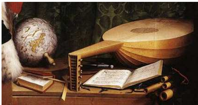
Imagen de Hans Holbein El Joven bajo Dominio público

El género lírico va a ser el motor de la renovación literaria del XVI . En la "sección de préstamos", con el tejuelo "P BOS obra", está la edición de las obras completas de Juan Boscán , poeta y traductor renacentista, influido por el embajador veneciano y gran humanista Andrea Navagiero . Con estas amistades, nuestro poeta va a introducir los nuevos usos y temas literarios, próximos a los italianos. Leamos este fragmento suyo de la Carta Prohemio a la Duquesa de Soma , de 1543, donde se apuntan ya las innovaciones literarias.