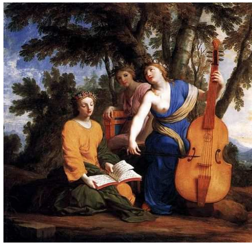
Imagen de Eustache Le Sueur . Bajo Dominio público

Entre los relatos de ficción idealizantes , cuyo modelo se encuentra en los clásicos, podemos encontrar: