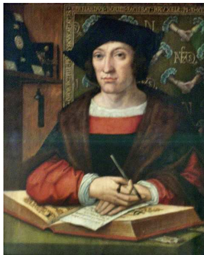
Imagen de Bernard Van Orley . Bajo Dominio público

Como puedes apreciar, el texto presenta un conflicto amoroso, que va a ser el argumento principal de la obra en general. Investiguemos en qué marco se produce este conflicto y por qué sufre de esta manera el protagonista.