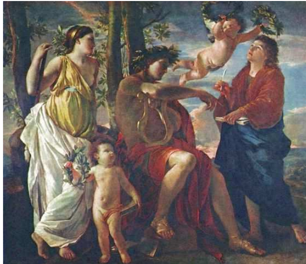
Imagen de Nicolas Poussin . Bajo Dominio público

El género pastoril es muy antiguo, ya se encuentra en escritores clásicos como Teócrito y Virgilio , creadores del género bucólico y, a partir de ellos, se extendió por toda Europa. Con el Renacimiento tomó un nuevo impulso, y lo bucólico se convirtió en tema preferente de la poesía y de la novela.