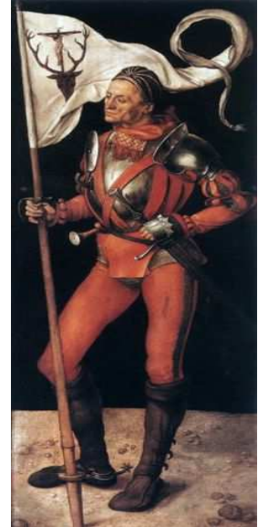
Imagen de: Alberto Durero bajo Dominio público

Viviréis al fin en ocio, más seguro y más amigo, fuera del áulico estruendo, y el cortesano delirio.