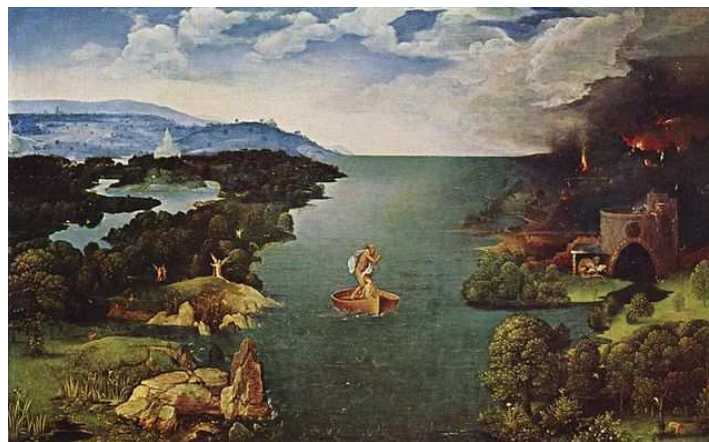
Imagen de Joachim Patinir . Bajo Dominio público

La novela de aventuras en los siglos XVI y XVII es, hasta cierto punto, continuación de la sentimental, pues ya esta última acogió elementos de diversa índole con el paso del tiempo. Se trataría, así, de una renovación para evitar tanta monotonía narrativa.