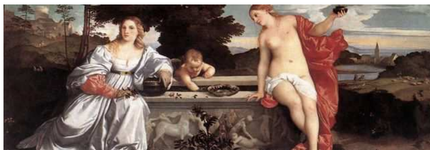
Imagen de Tiziano bajo Dominio público

Estas dos razones sirven para justificar buena parte de la producción poética y narrativa del Renacimiento español. Las obras que nos encontramos son el fruto de influencias internas y externas, y servirán, a su vez, ya convertidas en creación propia, para influir a otros escritores de la época. Caso más evidente de todo es el Quijote , que se verá en los siguientes temas.