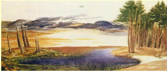
Imagen de Alberto Durero . Bajo Dominio público

Vivir quiero conmigo, gozar quiero del bien que debo al cielo, a solas, sin testigo, libre de amor, de celo, de odio, de esperanzas, de recelo.