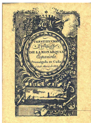
Portada de la edición original de la Constitución de Cádiz de 1812.