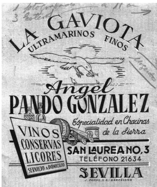
Cartel La Gaviota. Ultramarinos finos.

Es importante tener en cuenta los recursos que la Web hoy día nos ofrece. En este sentido, diferentes estamentos de la administración cultural europea, española y andaluza, nos ofrecen unos catálogos magníficamente organizados y con unos fondos extraordinarios. Textos, imágenes, audios, vídeos, cortos, tradiciones orales... Todo cabe en Webs como Europeana, la Biblioteca Virtual del Patrimonio Bibliográfico español, la Biblioteca Virtual de Prensa Histórica y la Biblioteca Virtual de Andalucía.