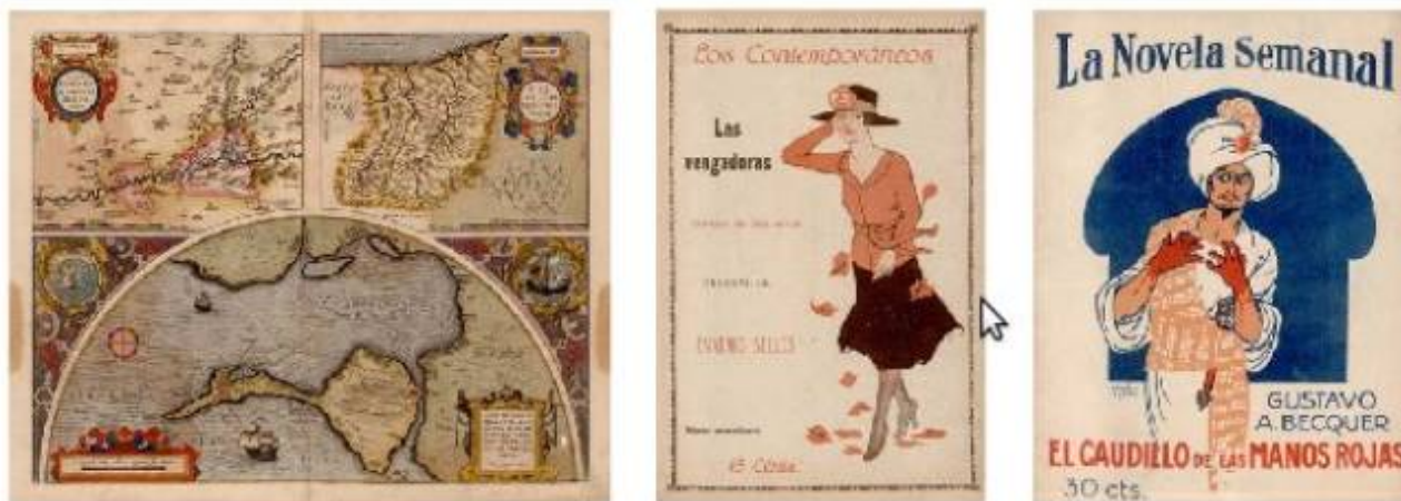
Ejemplos de la colección de documentos de la Biblioteca Virtual de Andalucía.