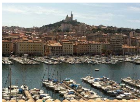
Vieux Port de Marseille.

Le 15 janvier 2013, Marseille est devenue officiellement la capitale européenne de la culture pour un an. Cette nomination est le résultat de la politique culturelle que la municipalité a mis en priorité depuis plus de quinze ans.