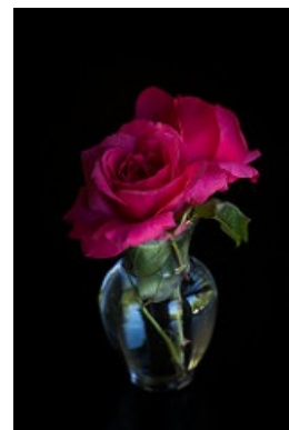
Imagen en Flickr de hjl bajo