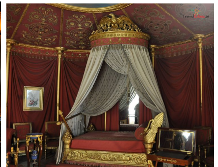
Cama Imagen de laetitiafp en Flickr . Licencia cc