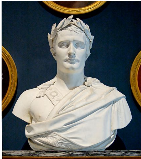
Busto de Napoleón, 1811 Imagen en Wikimedia . Dominio público