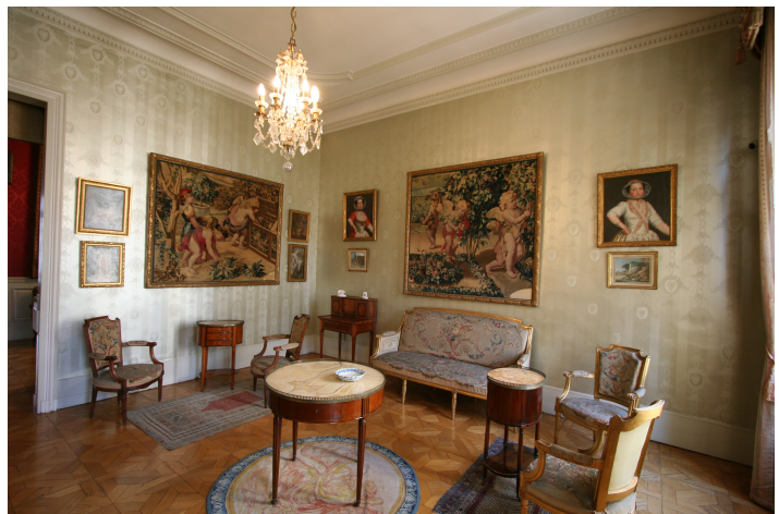
Salón Luis XVI

En general, los muebles de este momento guardan una estrecha relación con las formas clásicas de la arquitectura. Su rechazo a la exageración del rococó da como consecuencia unas líneas sobrias y simétricas que se alejan de las severas ondulaciones del estilo anterior, aunque aún se conservan pequeñas curvas que suavizan el mobiliario para dotarlo de elegancia y armonía. A la profusión decorativa le sigue la simplicidad y la moderación, a las formas enortijadas la geometría y rectas, a la asimetría la proporción, dando como resultados unos muebles ágiles, llenos de gracia y exquisitez, destinados a una vida de una sociedad que busca la intimidad y la comodidad.