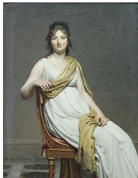
David, Madame de Verninac , 1799 Imagen en Wikipedia . Dominio público

En la última década del dieciocho surge en la Francia revolucionaria una nueva forma de vestir igual de revolucionaria que se denomina Estilo Directorio o de transición al Estilo Imperio , que coincide con la penúltima forma de gobierno de la República antes del golpe de estado de Napoleón en 1799. Esta moda está enormemente influida por la forma de vestir de los griegos durante la época clásica, de hecho, especialmente las mujeres, parecían verdaderas estatuas animadas griegas. Predominan las líneas sencillas en vestidos ligeros de muselina, gasa, algodón o linón, parecido al lino actual, de colores claros, entallados debajo del pecho que conforman un talle alto y una silueta bien esbelta. El pelo se lleva corto, recogido y con pequeños bucles rizados, y los únicos adornos eran pequeños camafeos, brazaletes y sencillas diademas .