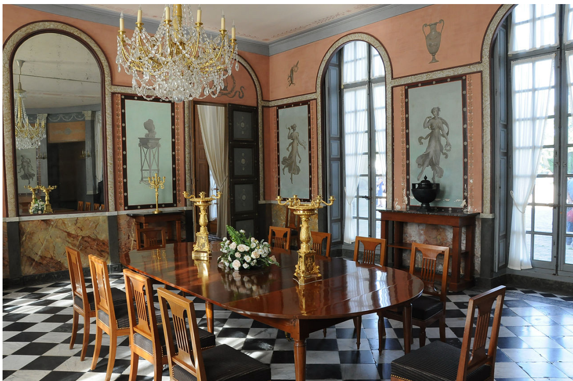
Comedor del Chateau de Malmaison. Estilo Imperio.

De la explosión decorativa a la vuelta a los orígenes La pintura y las artes decorativas del Neoclásico