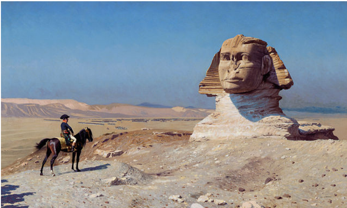
Jean-Léon Gérôme, Bonaparte ante la esfinge , 1868