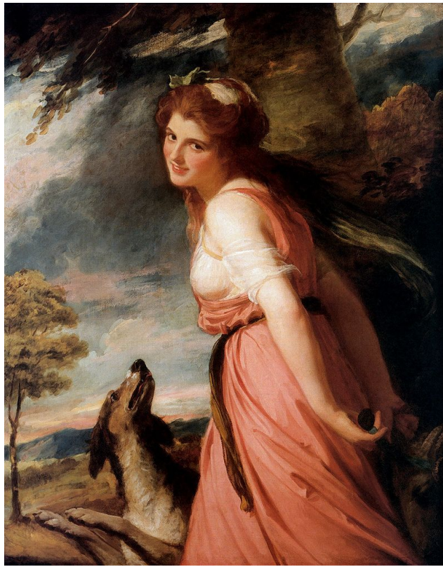
Lady Hamilton como bacante