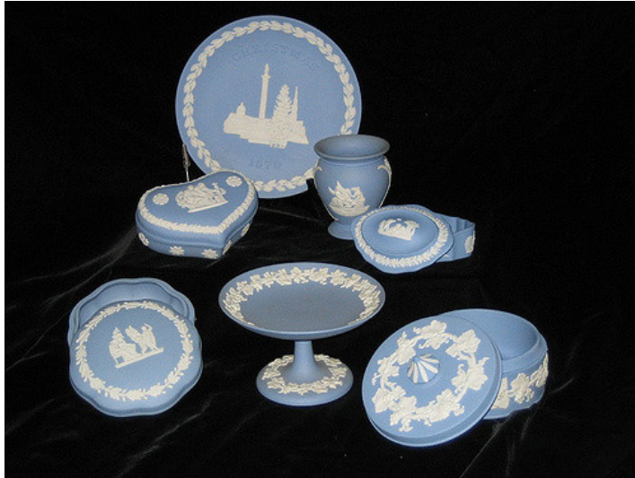
Piezas de cerámica con relieves en porcelana Wedgwood

más variadas piedras como el basalto y el ónice en ese característico tono azul mate de sus piezas a los que superponía delicados relieves en porcelana blanca con motivos de la antigüedad clásica. Wedgwood fue el primero en utilizar una máquina de vapor para la fabricación industrial de piezas cerámicas con moldes, y entre sus clientes se encontraban Catalina la Grande de Rusia o los primeros presidentes de los Estados Unidos.