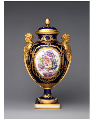
Vaso de porcelana de Sèvres, 1788

Las piezas más características de estos años son las denominadas cerámica Wedgwood , fruto de la unión de destreza técnica y producción industrial en serie. Su fundador fue el ceramista inglés Joshia Wedgwood , hijo de una estirpe de ceramistas que funda su propia fábrica en 1754 y con una gran visión comercial registra todos sus experimentos. El éxito le llegó en 1765 cuando recibe el encargo de la reina Carlota, esposa del monarca Jorge III, de fabricar una vajilla para su residencia real. Tanto le gustó a la reina esas piezas realizadas en color crema que animó a Wedgwood a que la registrara con el nombre de cerámica de la reina .