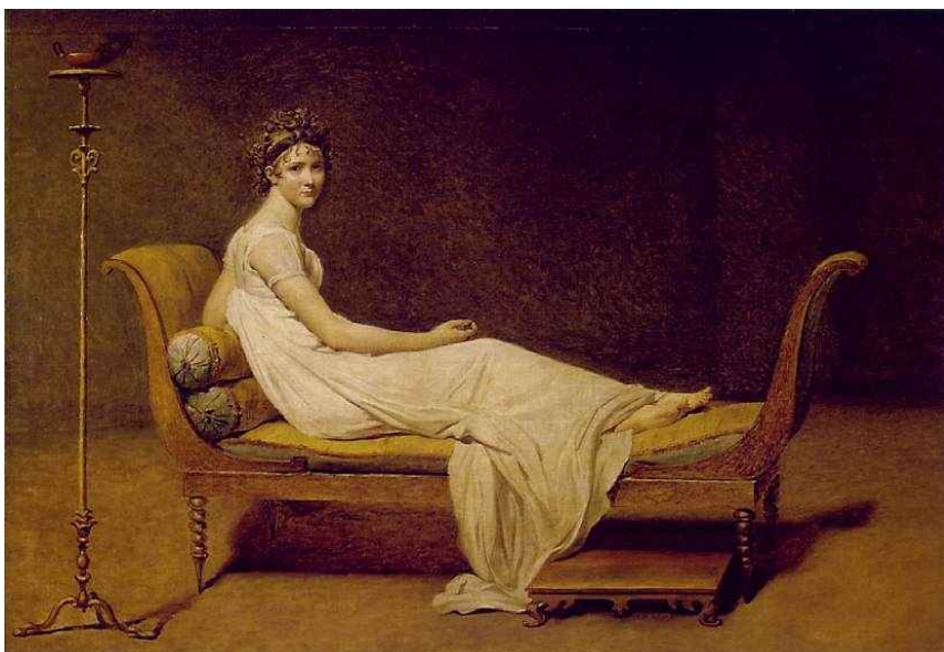
Jacques-Louis David, Madame Récamier, 1800

Al igual que el mundo se transformó profundamente tras la Revolución Francesa, la forma de vestir también cambió radicalmente . Atrás quedaron los rígidos y ostentosos vestidos que simbolizaron el Antiguo Régimen para dar paso a una moda más en consonancia con las clases bajas del proletariado y el campesinado. En los últimos años del siglo XVIII no podías ni siquiera aparentar ser de la aristocracia, pues rápidamente te asociaban como enemigo de los nuevos valores de Libertad, Igualdad y Fraternidad que proclamó la I República Francesa y hasta tu vida corría peligro de ser aniquilada en la guillotina. De esta forma, rápidamente fueron abandonados los ricos ropajes de brocados y pedrería, las pelucas imposibles y los descomunales guardainfantes, y se optó por unos tejidos ligeros y baratos como el algodón y la gasa, los colores claros y el pelo natural corto.