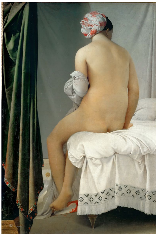
La bañista de Valpinçon