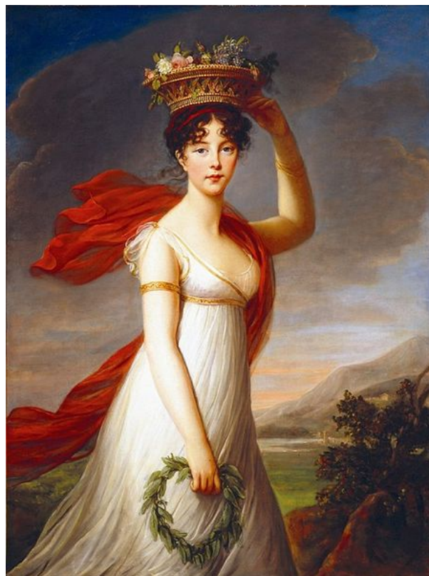
Vigée Le Brun, Retrato de Julia como Flora, 1799