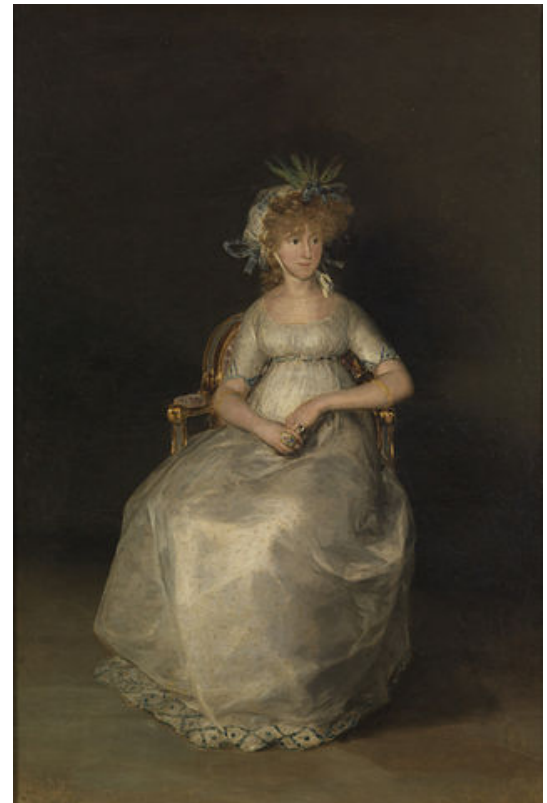
Goya, La condesa de Chinchón , 1800

Las piezas de porcelana y cerámica pronto se adaptan a esta nueva estética, destacando la porcelana de Sèvres y la cerámica Wengwood , pionera en la utilización de la máquina de vapor para fabricar piezas artísticas.