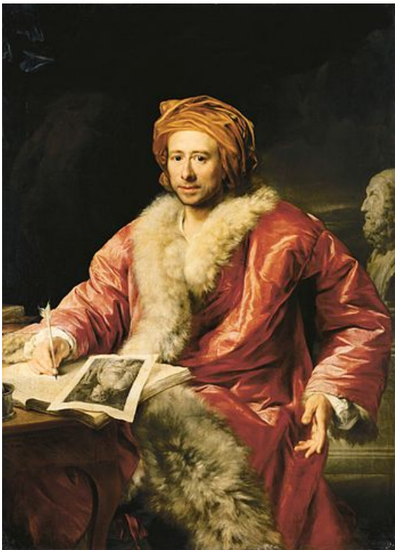
Anton von Maron, Retrato de Winckelmann, 1768