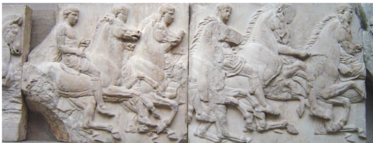
Detalle del friso del Partenón Imagen de ChrisO en Wikipedia . Licencia GNU