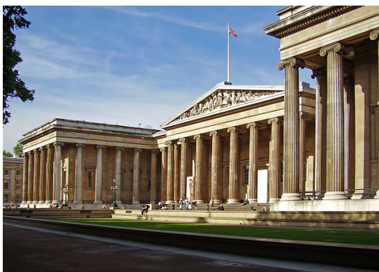
Fachada del Museo Británico

el Museo Egipcio de El Cairo, el Museo Británico posee la colección más importante de arte egipcio , así como los valiosos frisos del Partenón de Atenas, las esculturas del Mausoleo de Halicarnaso , que fue una de las siete maravillas del arte antiguo, así como la piedra de la Rosetta .