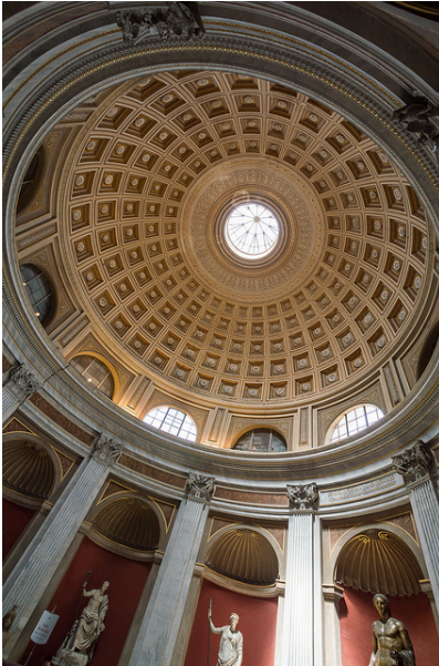
Interior de los Museos Vaticanos

colección del papa Julio II y bajo el impulso del gran historiador y arqueólogo Winckelmann. En San Petersburgo existe una de las mayores pinacotecas del mundo, el Museo del Hermitage . Lo forman seis opulentos edificios a orillas del río Neva siendo el más impresionante el Palacio de Invierno, antigua residencia de los zares.