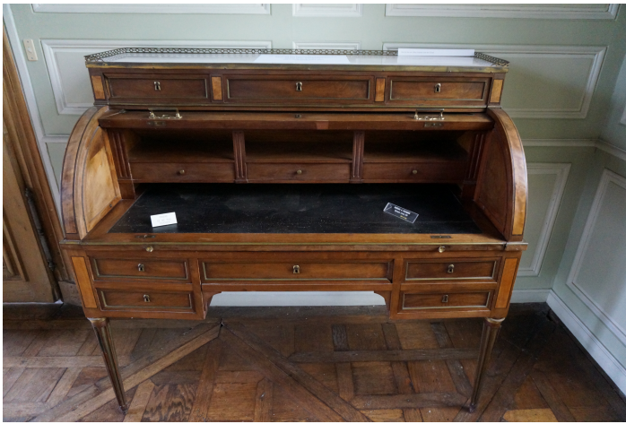
Bureau estilo Luis XVI

Imagen de G.Garitanen Wikimedia Commons . Licencia cc