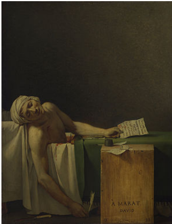
Muerte de Marat Imagen en Wikipedia . Dominio público.