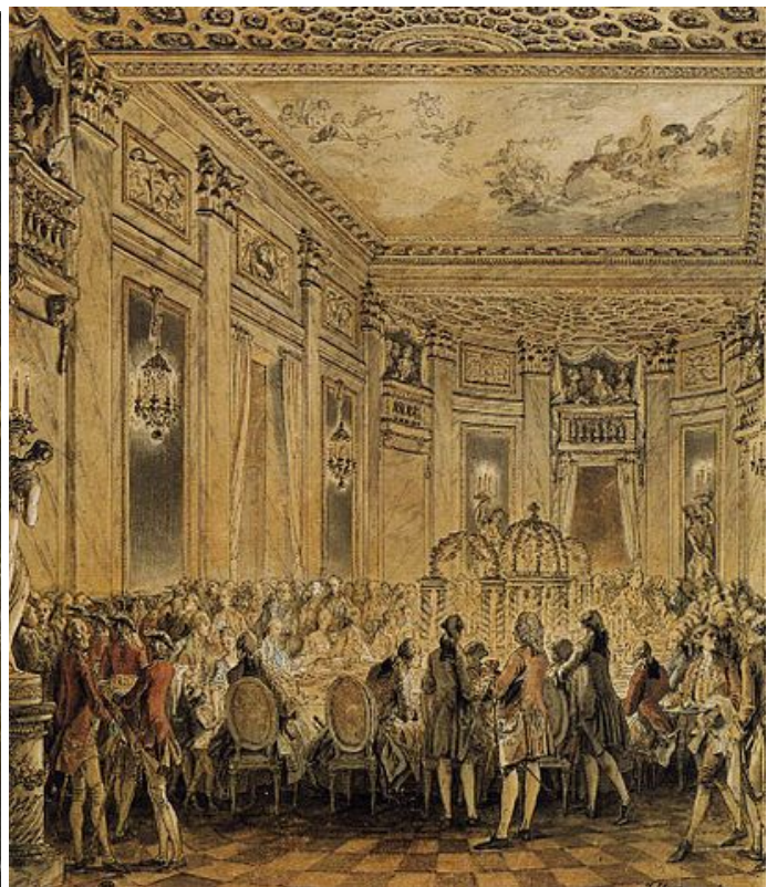
Jean-Michel Moreau, Inauguración del castillo de Louveciennes , 1771 Imagen en Wikimedia . Dominio público