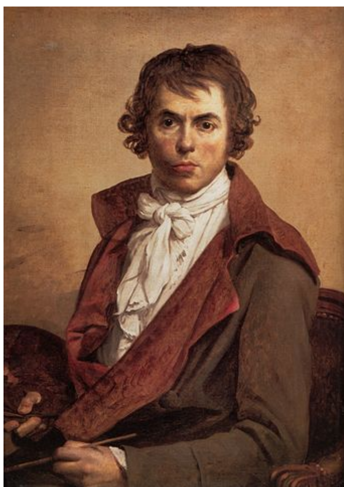
Autorretrato de Jaques-Louis David en 1794

Se completaba el atuendo con un ligero maquillaje nada llamativo, el cabello natural recogido con diadema y asomando pequeños bucles rizados, y los zapatos preferidos eran las balerinas , zapatos planos sin tacón. El icono de la moda de comienzos del siglo XIX fue la emperatriz Josefina, esposa de Napoleón.