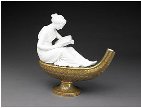
Pieza de Sèvres de 1786