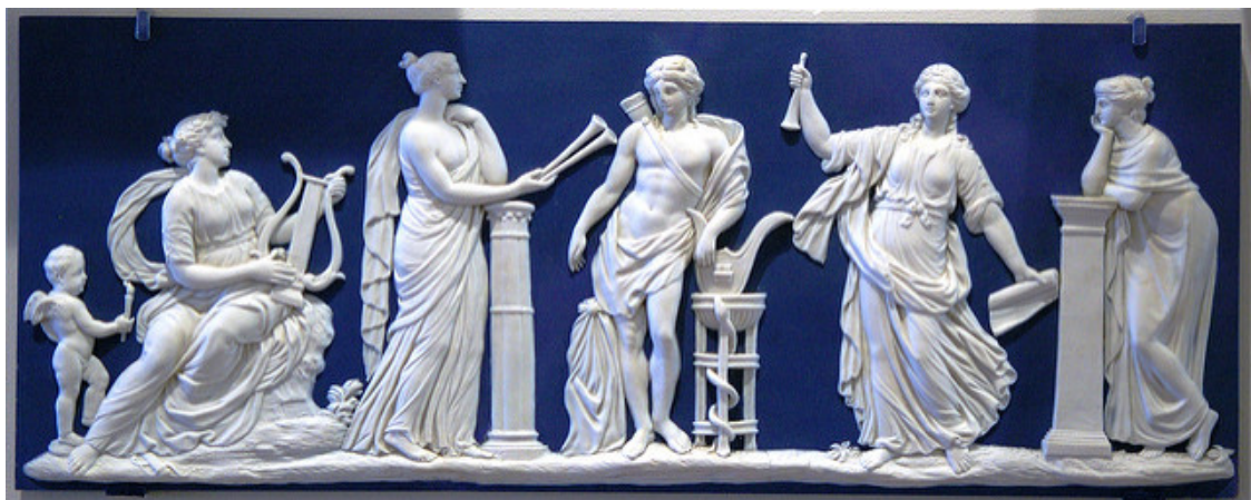
Cerámica Wedgwood

Las piezas más características de estos años son las denominadas cerámica Wedgwood , fruto de la unión de destreza técnica y producción industrial en serie. Su fundador fue el ceramista inglés Joshia Wedgwood , hijo de una estirpe de ceramistas que funda su propia fábrica en 1754 y con una gran visión comercial registra todos sus experimentos. El éxito le llegó en 1765 cuando recibe el encargo de la reina Carlota, esposa del monarca Jorge III, de fabricar una vajilla para su residencia real. Tanto le gustó a la reina esas piezas realizadas en color crema que animó a Wedgwood a que la registrara con el nombre de cerámica de la reina .