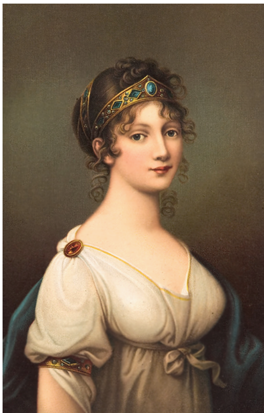
La reina Luisa de Prusia luciendo diadema y brazalete, 1804

La joyería neoclásica es ante todo simple y elegante . Atrás quedaron los excesos y las mezclas de los más diversos materiales de otras épocas. Ahora lo que gusta es la simplicidad, la simetría , las formas sencillas y la pureza de los materiales , con combinaciones de no más de tres elementos. A las decoraciones con hojas de acanto y órdenes clásicos hay que sumar todo un repertorio inspirado en el antiguo Egipto : pirámides, esfinges, máscaras de animales, hojas de papiro, flores de loto y escarabajos también formarán parte de joyería de este periodo pues las campañas de Egipto del emperador Napoleón a finales del siglo XVIII causaron verdadero furor en la vieja Europa.