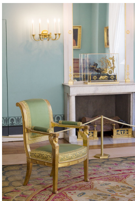
Silla con copete curvo

Y es que, a pesar del estilo clásico que se impone que podemos distinguir por sus líneas simples . Existe un gusto especial por decorar de manera singular. Por ejemplo, en las patas de los muebles se reproducen motivos animales o musicales . En el primero de los casos se opta por animales, cisnes o incluso figuras humanizadas como las cariátides. En la segunda opción son las liras, el instrumento atributo de Apolo. Otras veces combinan las líneas rectas en las delanteras y en sable las traseras . Los respaldos tienen una suave inclinación que termina en formas curvas . Los sillones son grandiosos, son muy curiosos los de aspecto enroscado. Las curvaturas se explayan en la silla de tipo curul que está inspirado en el asiento romano que dispone de una base de tijera. Se multiplican las mesas de aparador por las estancias, mientras que las camas son auténticos lechos que aparentan embarcaciones. Lo mejor para que te hagas una idea es ver los ejemplos de estos muebles.