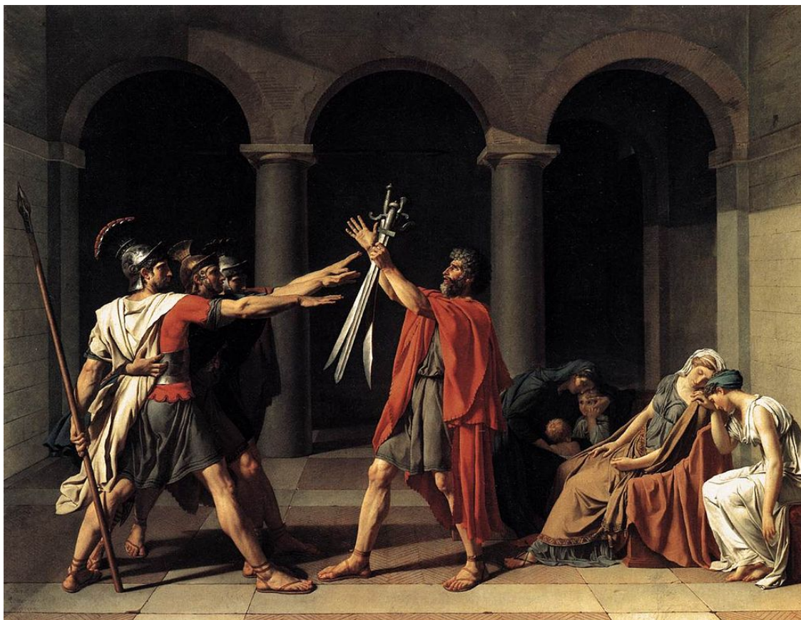
El juramento de los Horacios, Jacques Louis David Imagen de Jacques-Louis David en Wikipedia . Dominio público