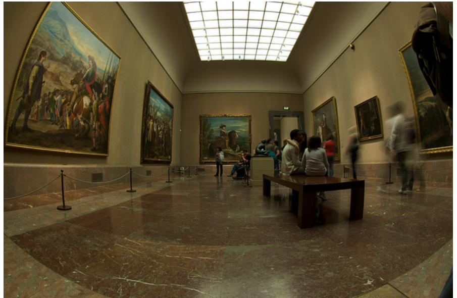
Interior de una de las salas de Velázquez del Museo del Prado