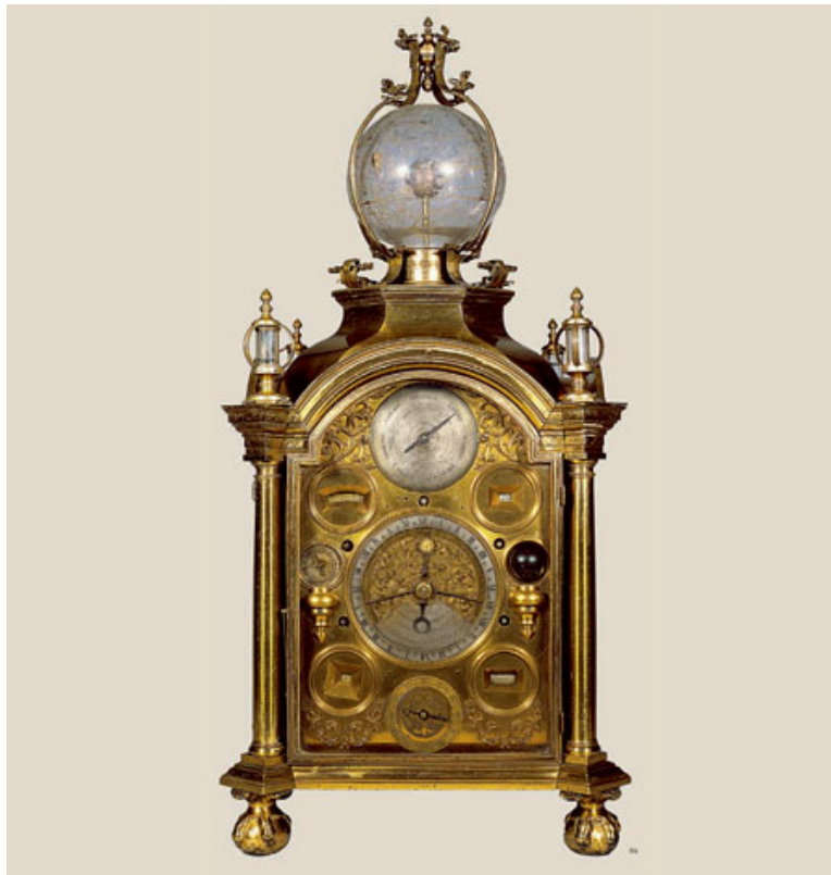
Reloj de sobremesa Las cuatro fachadas