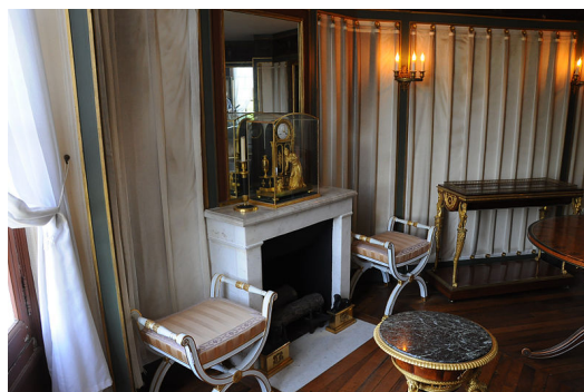
Silla curul