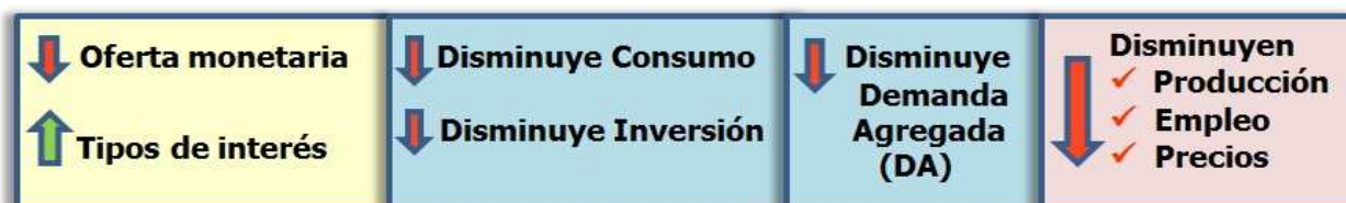
Imagen de elaboración propia

No obstante, esta política puede conducir a una falta de liquidez de la economía que limite las posibilidades de crecimiento económico y de generación de empleo. A las empresas les resultará más caro pedir prestado para financiar sus proyectos de inversión, con lo que probablemente no los llevarán a cabo.