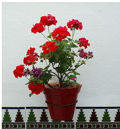
Imagen de Michelangelo-36 en Flickr bajo licencia de CC