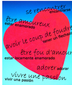
Imagen de producción propia