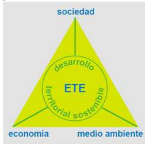
Fig. 5: Triángulo de objetivos: desarrollo equilibrado y sostenible del territorio