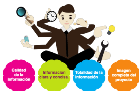
Plan de empresa Diagrama de elaboración propia