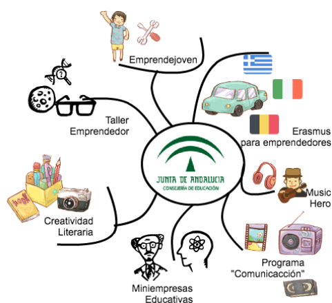
Acciones de la Junta de Andalucía Diagrama de elaboración propia