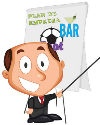
Plan de empresa Diagrama de elaboración propia

Ya tenemos algo claro cómo debe ser el contenido del plan. Diferente es cómo presentarlo. Ya has podido leer que pueden ser muchas las personas que van a acceder a este documento y en la mayoría de los casos, disponen de poco tiempo.