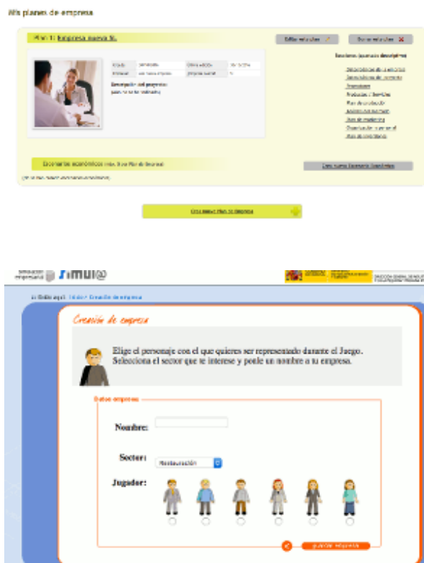
Plan de Empresa y Simulador Empresarial

Para realizar tu plan de empresa y con asistencia paso a paso, existe una útil herramienta del Ministerio de Industria, Energía y Turismo mediante la cual podrás desarrollarlo por internet. Podrás hacerlo paso a paso, desde cualquier ordenador conectado a la web y guardando automáticamente todos los pasos que hayas realizado. Lo interesante además, es que puede ser completado fácilmente por diferentes personas trabajando de manera independiente.