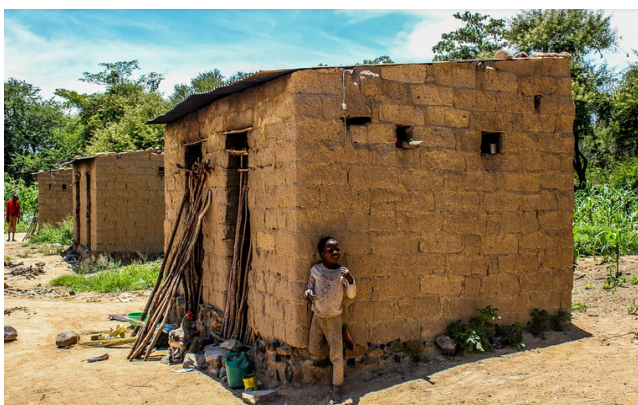
Casa pobre en Mozambique

El año 2015 un 0,7% de la población mundial (34 millones de personas) tenía el 45% de la riqueza mientras que un 74% (3.386 millones de personas) sólo poseían el 3% de la riqueza del planeta. Esta situación refleja un proceso que va en aumento y lastra la lucha contra la pobreza en el mundo. Por continentes norteamérica y Europa que representan la sexta parte de la población mundial detentan casi dos tercios de toda la riqueza del mundo. Estas cifras de desigualdad extrema en el reparto de la riqueza coinciden en gran parte con el comportamiento demográfico. Frente a un mundo rico, envejecido y con baja natalidad, un mundo cada vez más pobre en recursos con tasas de natalidad muy altas. El resultado es un aumento de los desequilibrios a nivel global.