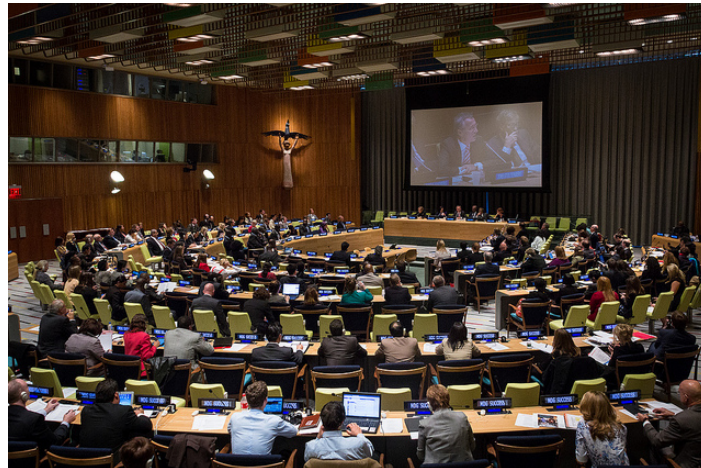
Reunión durante la celebración de la Asamblea General de la ONU, septiembre de 2013

El debate está servido. La ONU actualmente estima que la población está mejor alimentada que hace 40 años. En esa fecha el consumo de calorías era de 2.360 por persona y día, mientras que hoy esa cifra se ha elevado a 2.740 calorías. Según los expertos, son necesarias unas 2.400 calorías/día. Pero estos cálculos son estimaciones medias, y no debemos olvidar que gran parte de la población mundial consume menos de 2.000 calorías/día.