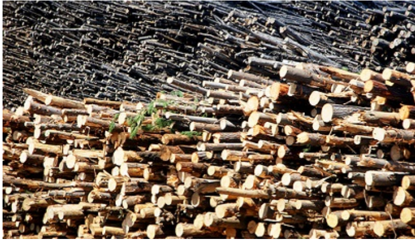
Recursos madereros en Complejo Forestal Industrial Horcones, Arauco, Chile