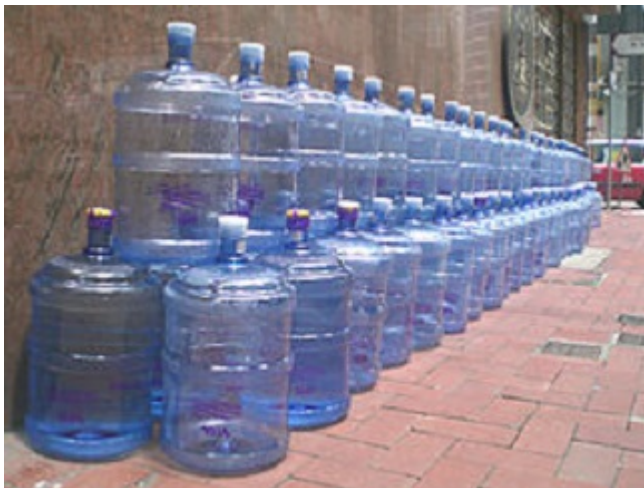
Botellas de agua mineral

El ser humano en el mundo Población y recursos