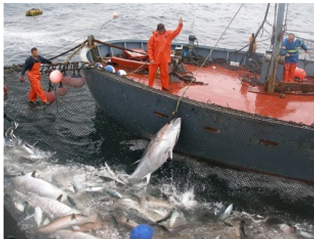
Recursos marinos: pesca de atunes en la almadraba de Tarifa (Cádiz)