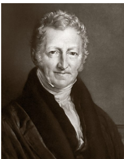
Thomas Robert Malthus (1766 - 1834)

Una tercera postura ante el problema del crecimiento de la población es la pronatalista , que defiende que el crecimiento de la población es beneficioso para el desarrollo económico y para el mundo. En esta línea se sitúan la Iglesia Católica, el Islam y otras muchas religiones.