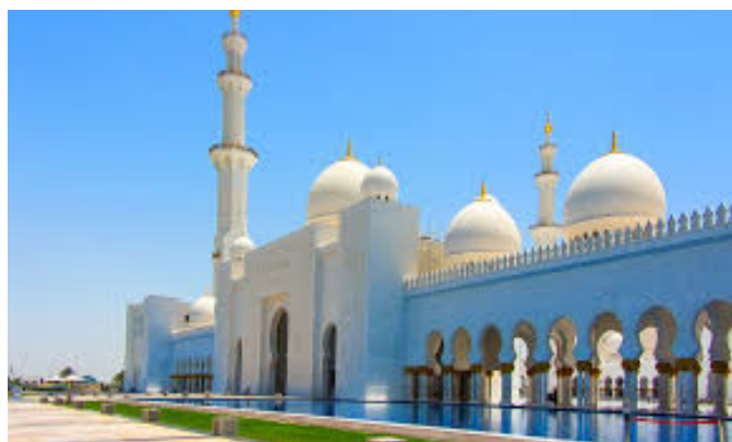
Mezquita de un jeque árabe en Dubai