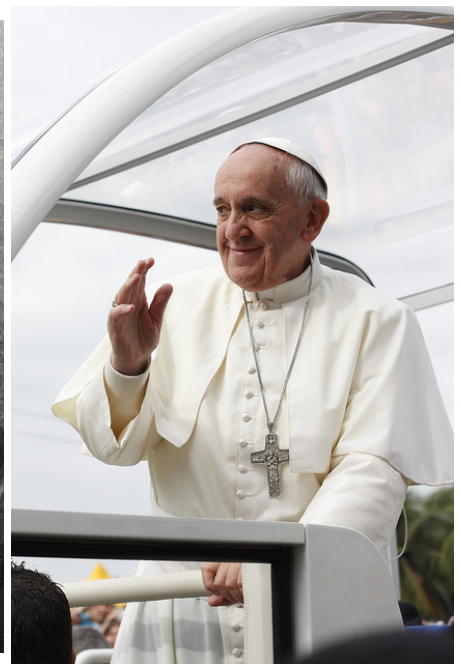
El Papa Francisco en Río de Janeiro (Brasil), julio de 2013