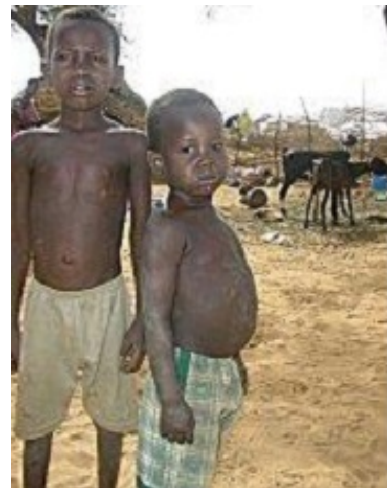
Niños malnutridos en Níger (África) en 2006