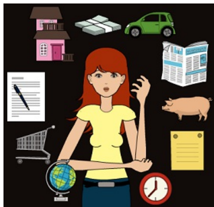
Imagen de elaboración propia