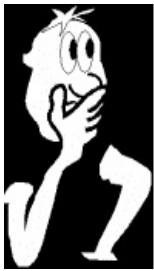
Banco de imágenes ITE Licencia Creative Commons

Seguro que, pensando en decisiones que hemos tomado últimamente, podemos comprobar que son numerosas las situaciones en las que debemos elegir entre distintas alternativas porque por cualquier motivo (tiempo, dinero, etcétera) no podemos llevar todas a cabo a la vez.