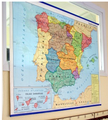
Banco de imágenes ITE Licencia Creative Commons