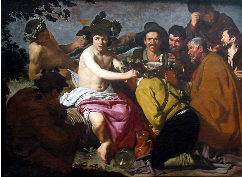
Los borrachos o El triunfo de Baco. Cuadro de Velázquez.

¿Razón o sinrazón? ¿Lo racional o lo irracional? Seguro que has sentido y vivido a menudo el conflicto entre lo razonable y lo que no lo es: tomar una decisión, hacer o no hacer algo... seguro que se te ocurren muchos ejemplos.