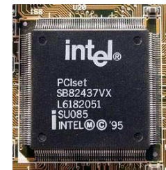
Imagen 4. Autor: Appaloosa . Creative Commons Attribution ShareAlike 3.0 License.

Se da cuando una o varias empresas imponen su dominio en el mercado, tenemos diferentes tipos: monopolio, oligopolio y competencia monopolística.