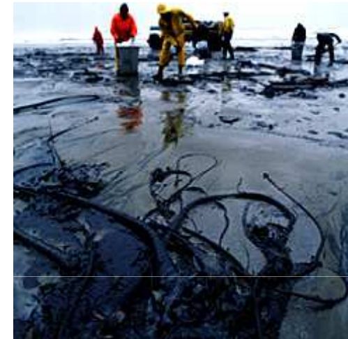
Imagen 3. Autor: Svdmolen . Imagen de dominio público.