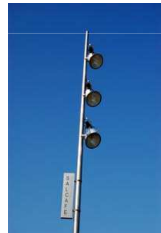
Imagen 2. Autor: creación propia.