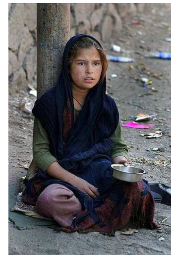
Imagen 5. Autor: Steve Evans . Creative Commons Attribution 2.0 License.

Es un fallo de equidad, ya que los agentes sólo pueden acceder al mercado si tienen capacidad adquisitiva. El Estado a través de las políticas distributivas intenta generar un reparto más igualitario.